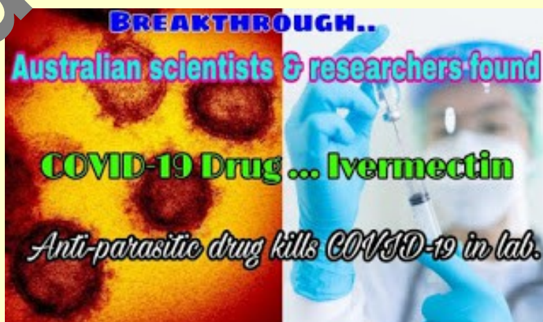
Foto: Průlom: australské vědci a badatelé našli lék proti COVIDu-19 ... Ivermectin.

Co dál? Mezi parazitem a virem je OBROVSKÝ rozdíl. A bioinženýři to věděli: proto je detailně zkonstruovaná tajná biologická zbraň Covid tak extrémně nebezpečná.