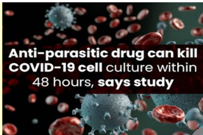
Foto: Studie praví, že antiparazitický lék může zabít buněčnou kulturu COVID-19 do 48 hodin.

„Jako integrativní medicínský konzultant a poradce pro koronaviry jsem brzy poznal, že COVID-19 není koronavirus. Můj první pacient s covidem začal vykazovat klasické příznaky covidu v prvním týdnu prosince r. 2019. Podle toho, jak příznaky odolávaly prakticky veškeré léčbě, kterou jsme předepsali, poznali jsme, že se nejedná o POUHÝ koronavirus. Po každém následujícím ataku nemoci se soubor symptomů buď zhoršil co do intenzity a počtu, anebo se proměnil ve zjevně odlišný chorobný proces. Tak jsme poznali, že máme co činit s vysoce sofistikovanou biologickou zbraní, podobnou jako bioinženýrsky vyrobená Lymská nemoc (Lyme Disease, LD), která byla vypuštěna z laboratoře na Plum Islandu u pobřeží Connecticutu kolem roku 1975. Také jsme pochopili, že to, co bylo záměrně pojmenováno „syndrom Covidu“, není ve skutečnosti způsobeno koronavirem (pokud se toho koronavirus vůbec účastní).