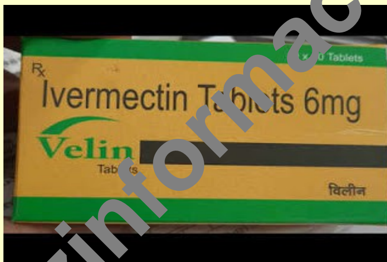
Foto: Proč Indie, "země parazitárních onemocnění", jako jedna z prvních schválila Ivermectin jako lék proti COVID-19?

Viz: COVIDgate: It's obviously a parasite, not a coronavirus. (COVIDGATE: Je to evidentně parazit, nikoli virus.)