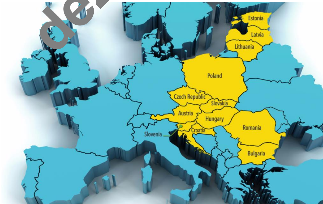
Americký projekt Trojmoří jako klínu mezi Západní Evropou pod vedením Berlína a Ruskem

A to když Miloš Zeman přinesl informaci o tom, že česká vojenská laboratoř v Brně v rámci protichemické obrany rovněž vyvíjí a vyráběla Novičok, ale čistě pro vědecké účely a zkoumání účinků Novičoku [1]. Tím byla vláda ČR usvědčena ze lži a byl tak vytvořen kontrolní mechanismus nad činností amerických tajných služeb v Praze, které už v roce 2018 neúspěšně tlačily na ukončení diplomatických vztahů ČR s Ruskem. Operace CIA "Permanent Victory" (Trvalé vítězství) pokračovala i v roce 2019, kdy pro změnu vypukla mohutná proti-čínská operace a hysterie proti firmě Huawei.