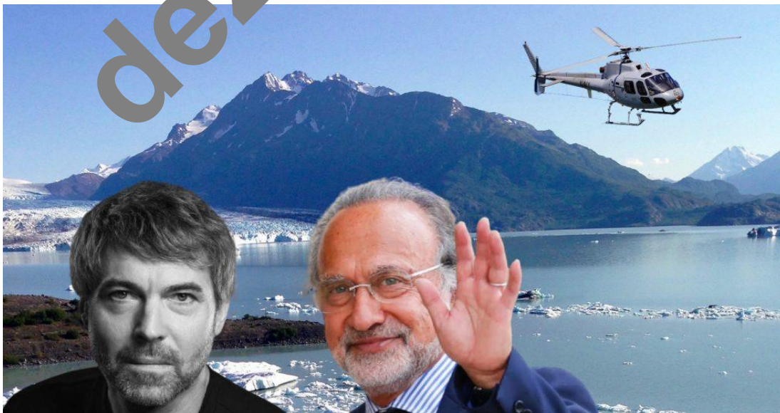
Petr Kellner a Olivier Dassault zahynuli s rozestupem 3 týdnů ve stejném typu helikoptéry

Podle ruských novinářů, kteří nás včera podobně informovali o situaci, se jedná o součást mohutné operace pod hlavičkou United States Central Intelligence Agency (CIA), která vyvrcholila 27. března 2021 na ledovci Knik na Aljašce, kde došlo k úmrtí hlavní postavy usilující o udržení normalizovaných vztahů mezi ČR a Ruskou federací, a která by nikdy nedovolila, aby došlo k tomu, co se odehrálo v budově vlády ČR minulou sobotu. Ruští novináři nyní zpracovávají informace o skupině několika lidí, kteří byli identifikováni na Aljašce jako operativní assety americké CIA těsně před smrtí Petra Kellnera.