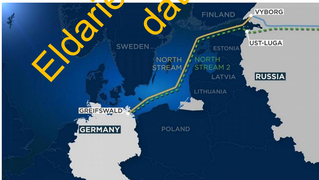
Nord Stream 1 a 2

Najednou můžeme vidět situace, kdy Křeml se v otázce bezpečnostní eskalace podněcované na Ukrajině Američany obrací o pomoc právě na Berlín, aby pomohl uklidnit situaci v Kyjevě. Německo je tak aktivně zapojováno do situace na Ukrajině na popud Moskvy, a protože Berlín je ten, který Kyjevu pouští peníze z EU, tak vliv Berlína na Kyjev je opravdu značný.