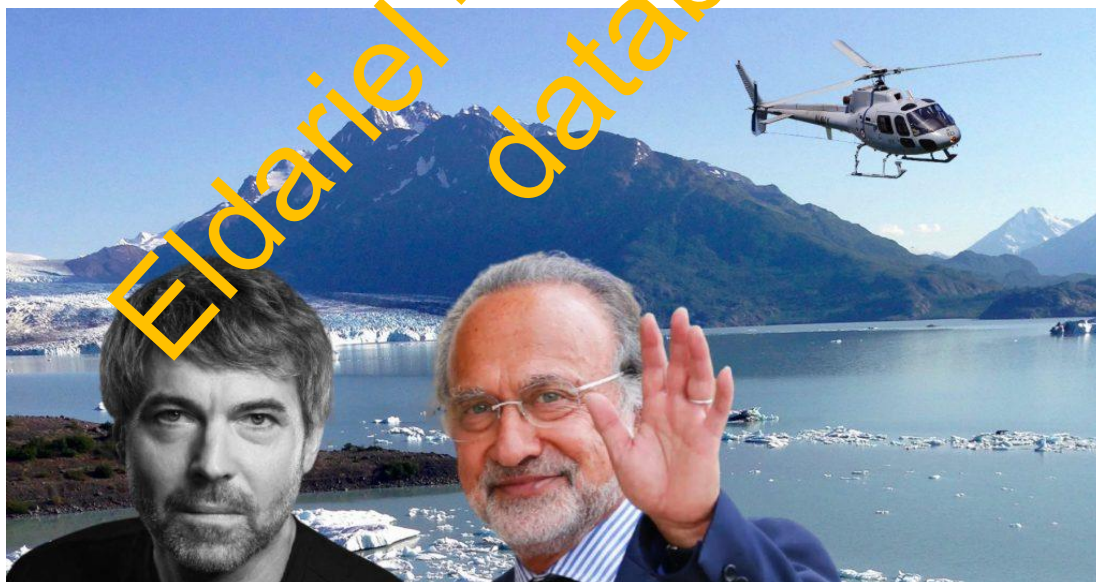
Petr Kellner a Olivier Dassault zahynuli s rozestupem 3 týdnů ve stejném typu helikoptéry

Podle ruských novinářů, kteří nás včera podrobně informovali o situaci, se jedná o součást mohutné operace pod hlavičkou Ústřední zpravodajské služby (CIA), která vyvrcholila 27. března 2021 na ledovci Knik na Aljašce, kde došlo k úmrtí hlavní postavy usilující o udržení normalizovaných vztahů mezi ČR a Ruskou federací, a které by nikdy nedovolila, aby došlo k tomu, co se odehrálo v budově vlády ČR minulou sobotu. Ruští novináři nyní zpracovávají informace o skupině několika lidí, kteří byli identifikováni na Aljašce jako operativní asety americké CIA těsně před smrtí Petra Kellnera.