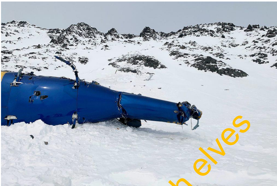
Skutálená helikoptéra Petra Kellnera na místě havárie na ledovci Knik na Aljašce

Je proto jasné, že smrt Petra Kellnera na Aljašce bude mít katastrofální dopady na mocenské procesy v Praze. Může to být jen krátkodobá výchylnka, než se stabilizuje situace v PPF a dojde k obnově moci nad Prahou, ale také se to nemusí povést a Českou republiku potká děsivý osud polandizace zahraniční politiky , tedy model zmanipulované politiky země, která je zcela oddána USA na straně jedné a plná nenávisti a zla proti Rusku na straně druhé. Budeme si muset počkat, jestli se PPF podaří nahradit tu obrovskou díru v mocenském úchopu nad Prahou po smrti Petra Kellnera.