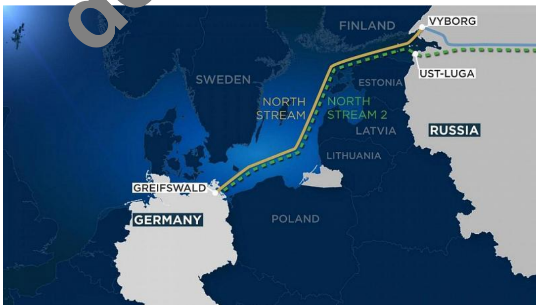
Nord Stream 1 a 2

Najednou můžeme vidět situaci, kdy Kreml se v otázce bezpečnostní eskalace podněcované na Ukrajině Američany obrací o pomoc právě na Berlín, aby pomohl uklidnit situaci v Kyjevě. Německo je tak aktivně zapojováno do situace na Ukrajině na popud Moskvy, a protože Berlín je ten, který Kyjevu poskytl peníze z EU, tak vliv Berlína na Kyjev je opravdu značný.