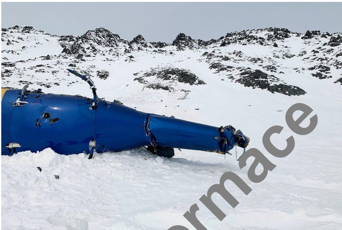
Skutálená helikoptéra Petra Kellnera na místě havárie na ledovci Knik na Aljašce

Je proto jasné, že smrt Petra Kellnera na Aljašce bude mít katastrofální dopady na mocenské procesy v Praze. Může to být jen krátkodobá výchylka, než se stabilizuje situace v PPF a dojde k obnově moci nad Prahou, ale také se to nemusí povést a Českou republiku potká děsivý osud polandizace zahraniční politiky , tedy model zahraniční politiky země, která je zcela oddána USA na straně jedné a plná nenávisti a zla proti Rusku na straně druhé. Budeme si muset počkat, jestli se PPF podaří zahradit tu obrovskou díru v mocenském úchopu nad Prahou po smrti Petra Kellnera.