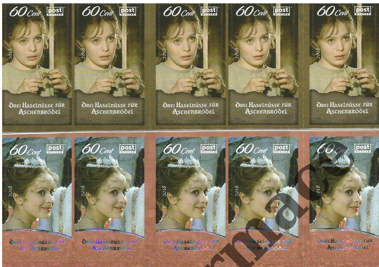
Pamětní edice známek s Libuší Šafránkovou jako Popelkou.

Není proto divu, že německé vydavatelství Post Modern vydalo speciální pamětní edici známek s Libuší Šafránkovou v roli Popelky. Jenže, má to zásadní háček. Nežijeme v roce 1973, kdy Evropa byla ještě normální a nezdegenerovaná, žijeme totiž na konci 2. dekády 21. století a všechno je jinak. K čemu vlastně došlo? Náš čtenář se rozhodl, že zašle kamarádovi do Francie vánoční pohled opatřený právě touto pamětní známkou s Libuší Šafránkovou, kde je vyobrazena s odhaleným krkem a krásným náhrdelníkem. Opravdu jí to moc sluší, česká herečka byla opravdu krásná a ve filmu doslova zářila. Jenže, co se nestalo. Když kamarád našeho čtenáře vánoční pohlednici ve Francii dostal, nestačil se divit.