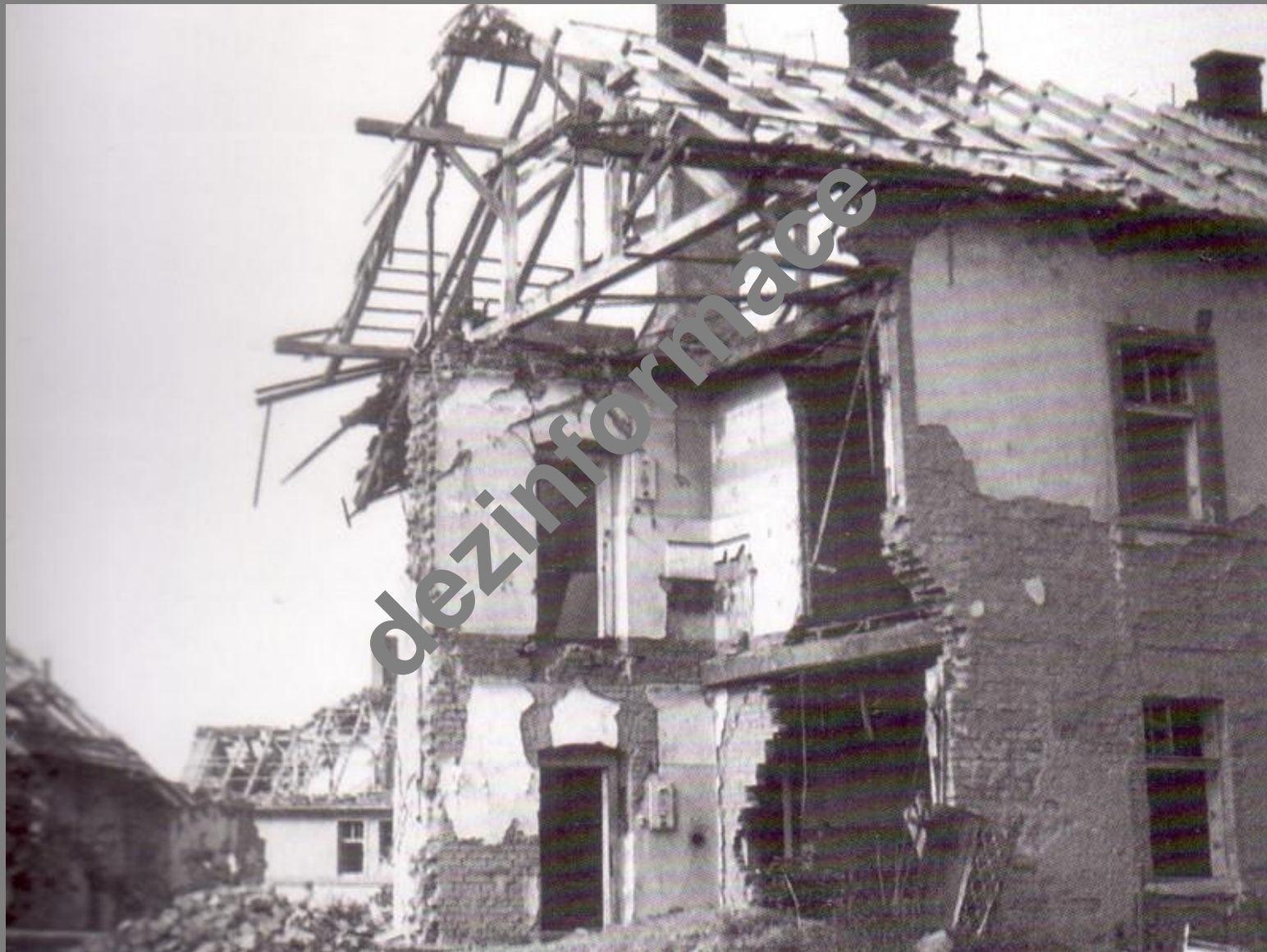
Jeden z postižených domů po přímém zásahu pumy při náletu 18. dubna 1945 na Slovany...