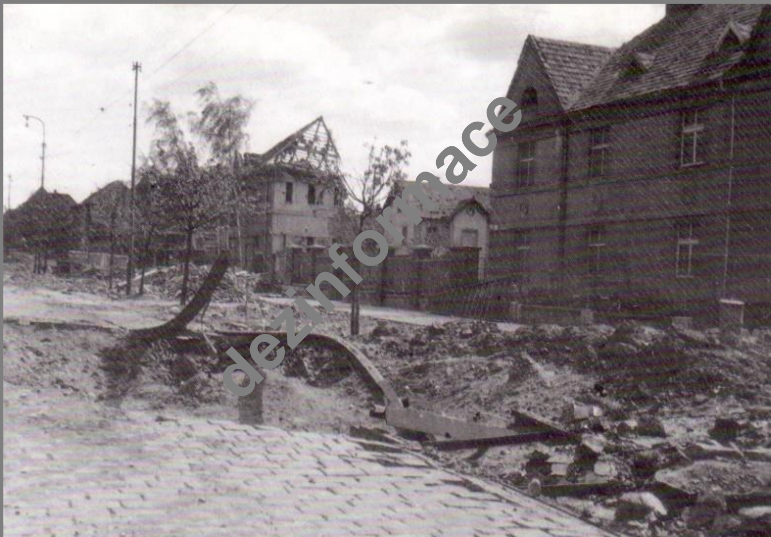
Motylí ulice svažující se k Radbuze po středečním náletu 18. dubna 1945...