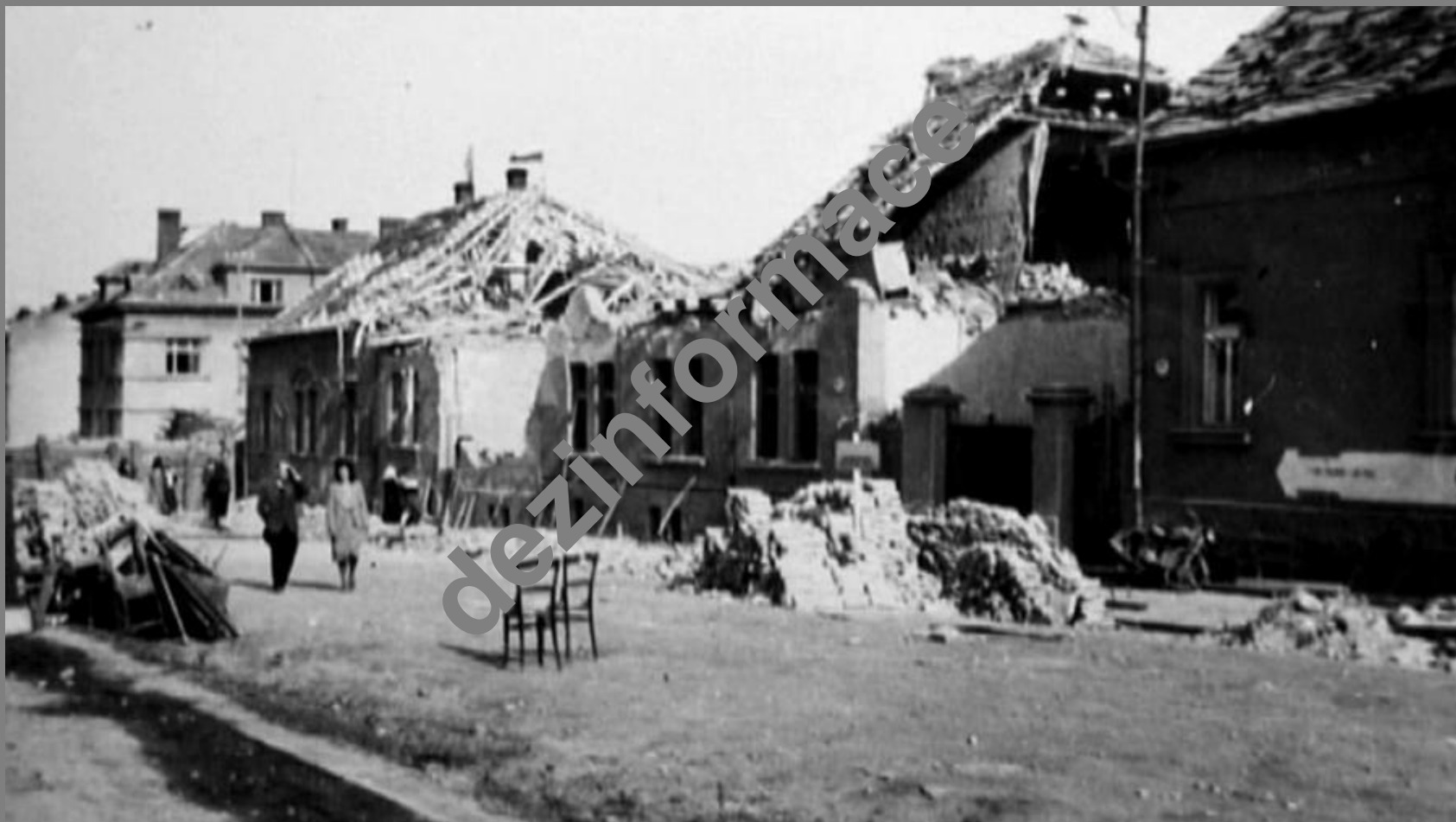
Jedna z ulic v centru tehdy německého Wiesengrundu, před válkou a po ní Dobřan...