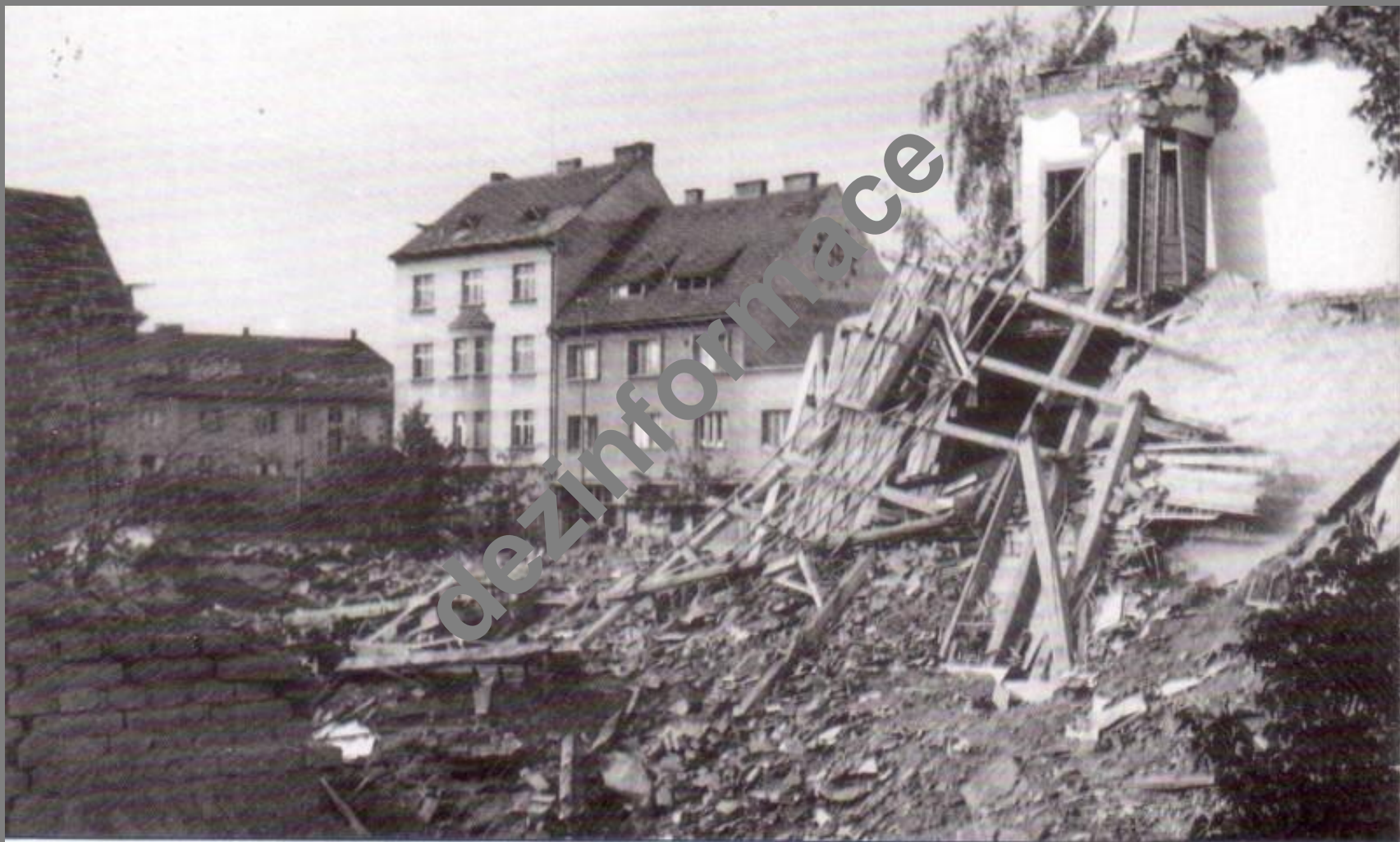
Střední část Nepomucké třídy na Slovanech, která byla postižena při odpoledním náletu amerických bombardérů 18. dubna 1945...