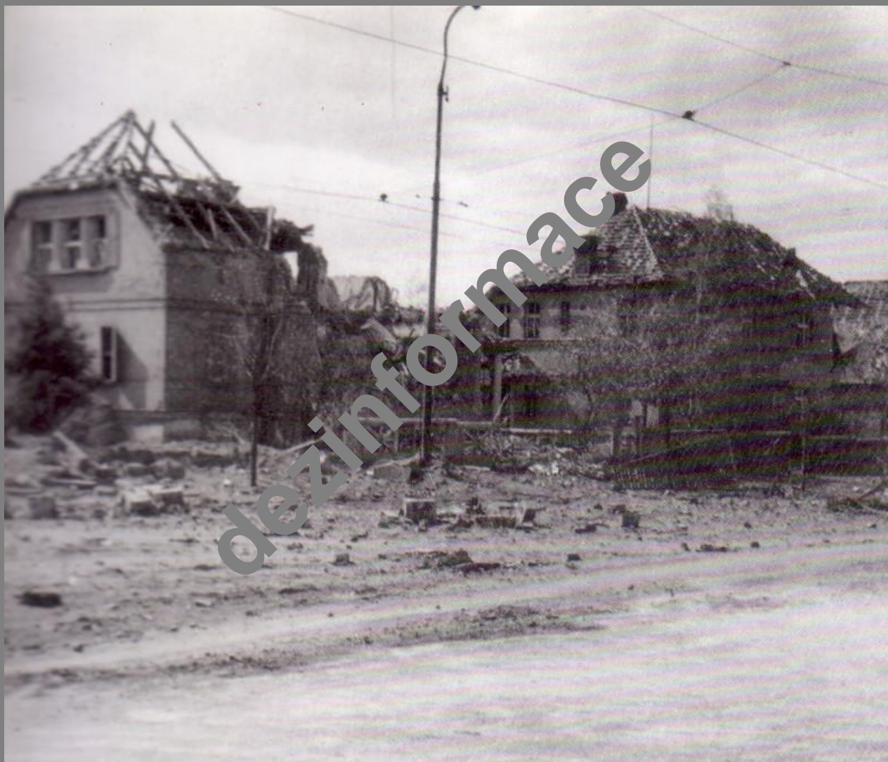
Nejvíce postižená oblast při náletu 18. dubna 1845 – vilová čtvrť pod Homolkou na Slovanech v ulicích Olšové, Polní a Zahradní ...