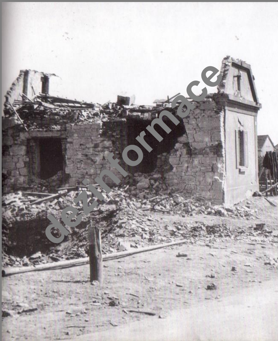
Dům na hranicích Bolevce a Košutky dostal přímý zásah. Jeho obyvatelé nepřežili...