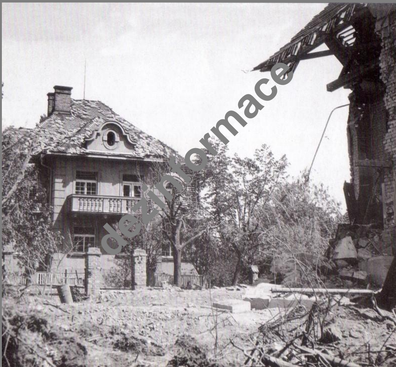
Jeden z domů ve vilové čtvrti při Karlovarské třídě, v jehož blízkosti dopadla letecká puma...