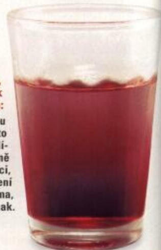
Polská vlajka, Polsko, plameňák nebo růžovka:

vlij do skla griotku a poté vodku; této receptuře čas neubli- žil, jde o vysloveně lahodnou kombinaci, jejíž vhodné složení je jedna ku dvěma, lze však i jinak.