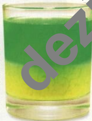
Zelený mozek čili četař: vaječný koňak pomalu nalévej do zelené.