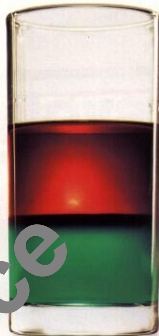
Vetřelec aneb cesta do pravěku: slij zelenou, fernet a rum; šikovným se nápoj odmění dramatickým rozhraním jednotlivých barev...