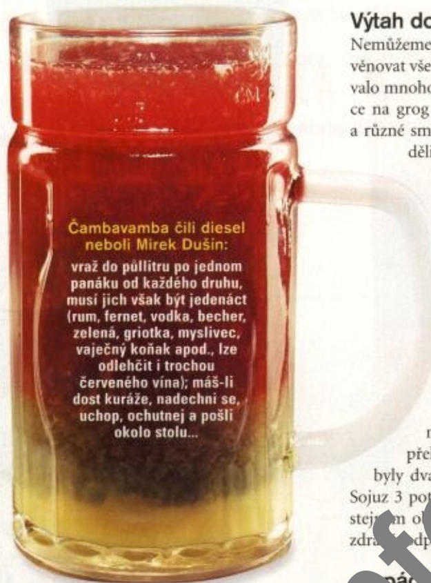
Čambavamba čili diesel neboli Mirek Dušin: