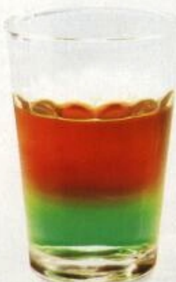
Koně v trávě, jinak též halí belí: na pepmintový základ zvolna nalij dávku rumu.