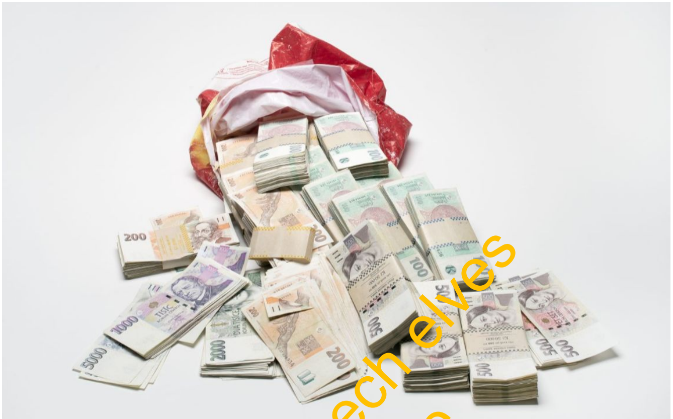
Mafie vybírala peníze v hotovosti a vozila je do Prahy v gelitkách.