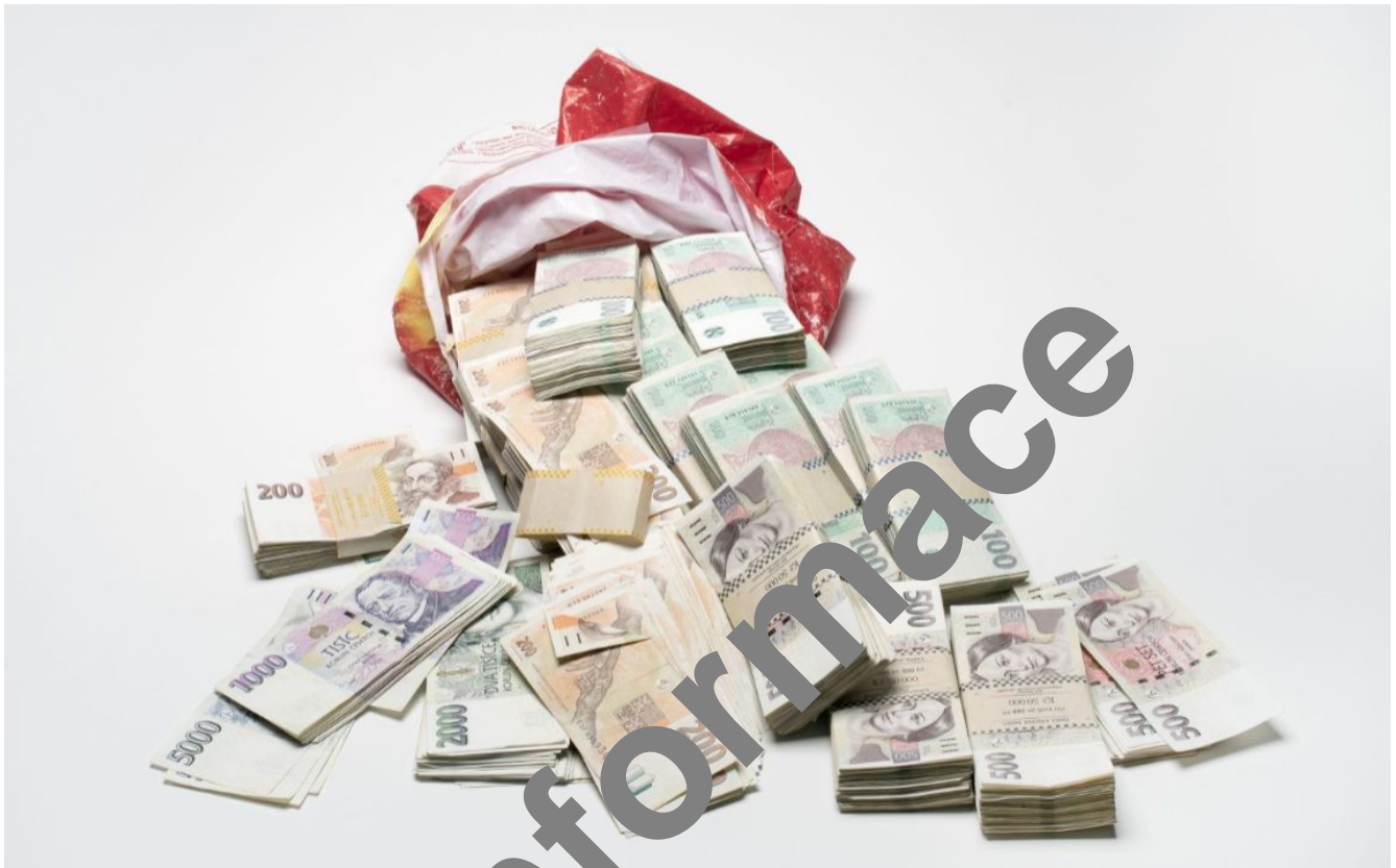
Mafie vybírá peníze v hotovosti a vozila je do Prahy v igelitkách.