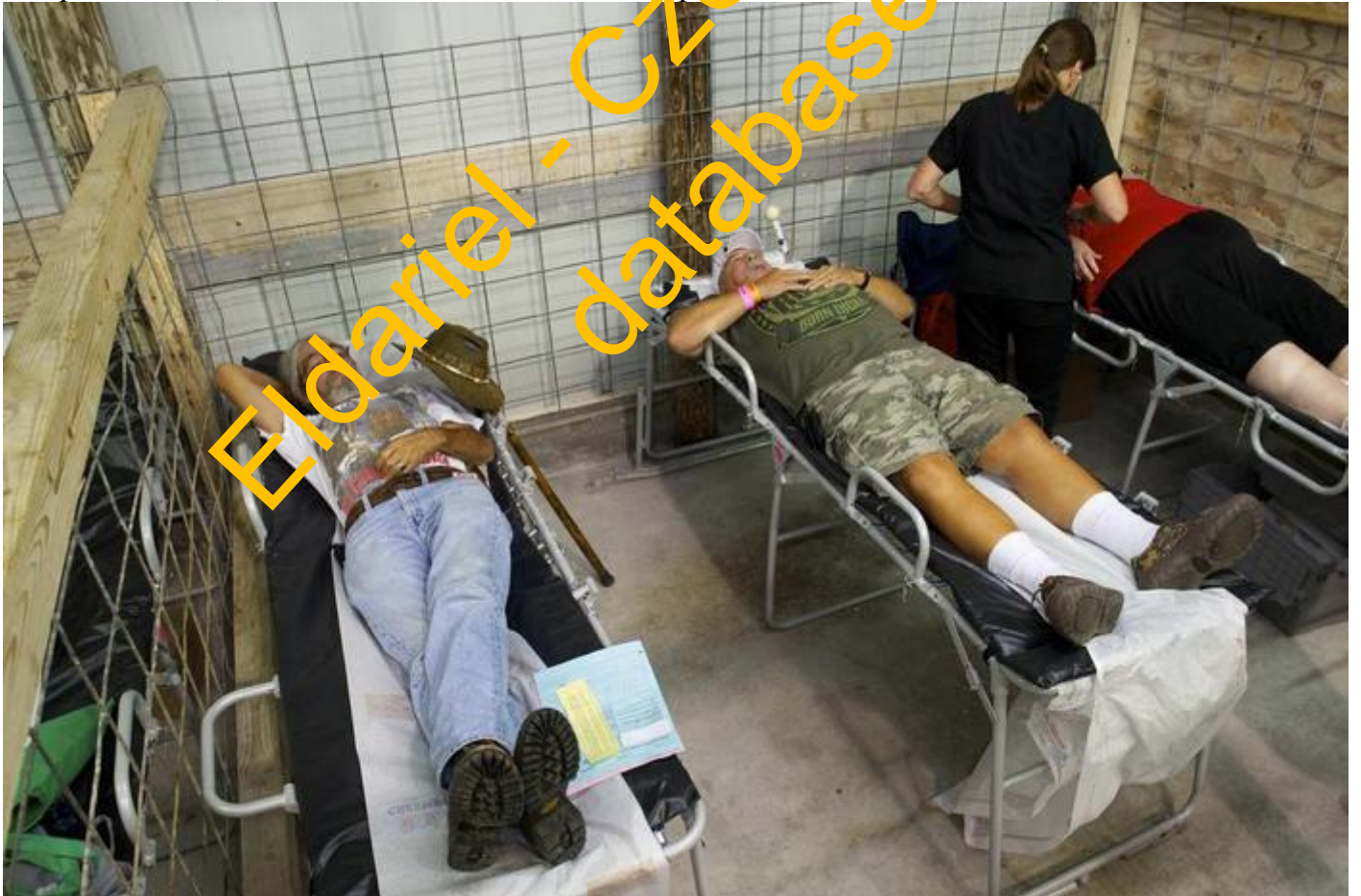
Záběr na improvizované lůžkové oddělení RAM kliniky. I tak může vypadat současné zdravotnictví nejvyspělejšího státu světa ...