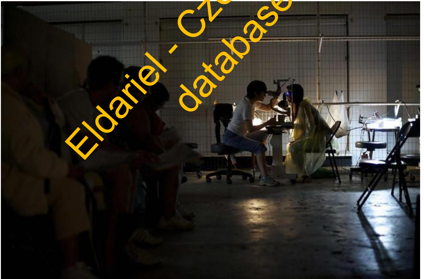
Kromě zubní péče nabízí RAM klinika i ošetření zraku.