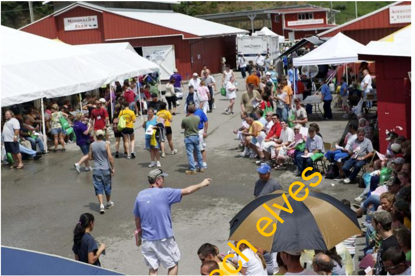
Takto vypadá prostranství před klinikou RAM. V areálu se nachází spousta lidí.