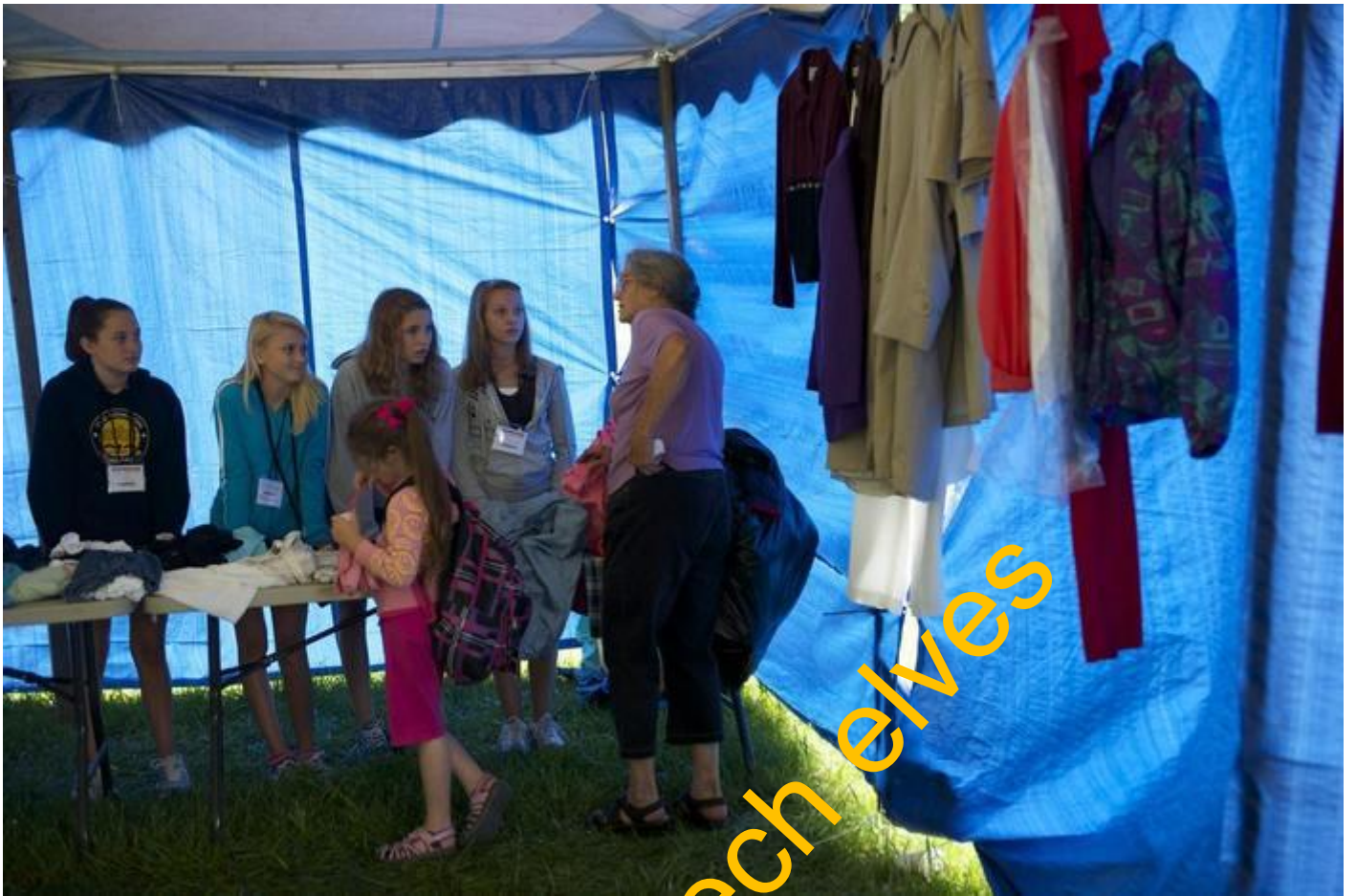
Uvnitř stanu, kde operuje personál RAM kliniky, je možné dostat zdarma i oblečení.