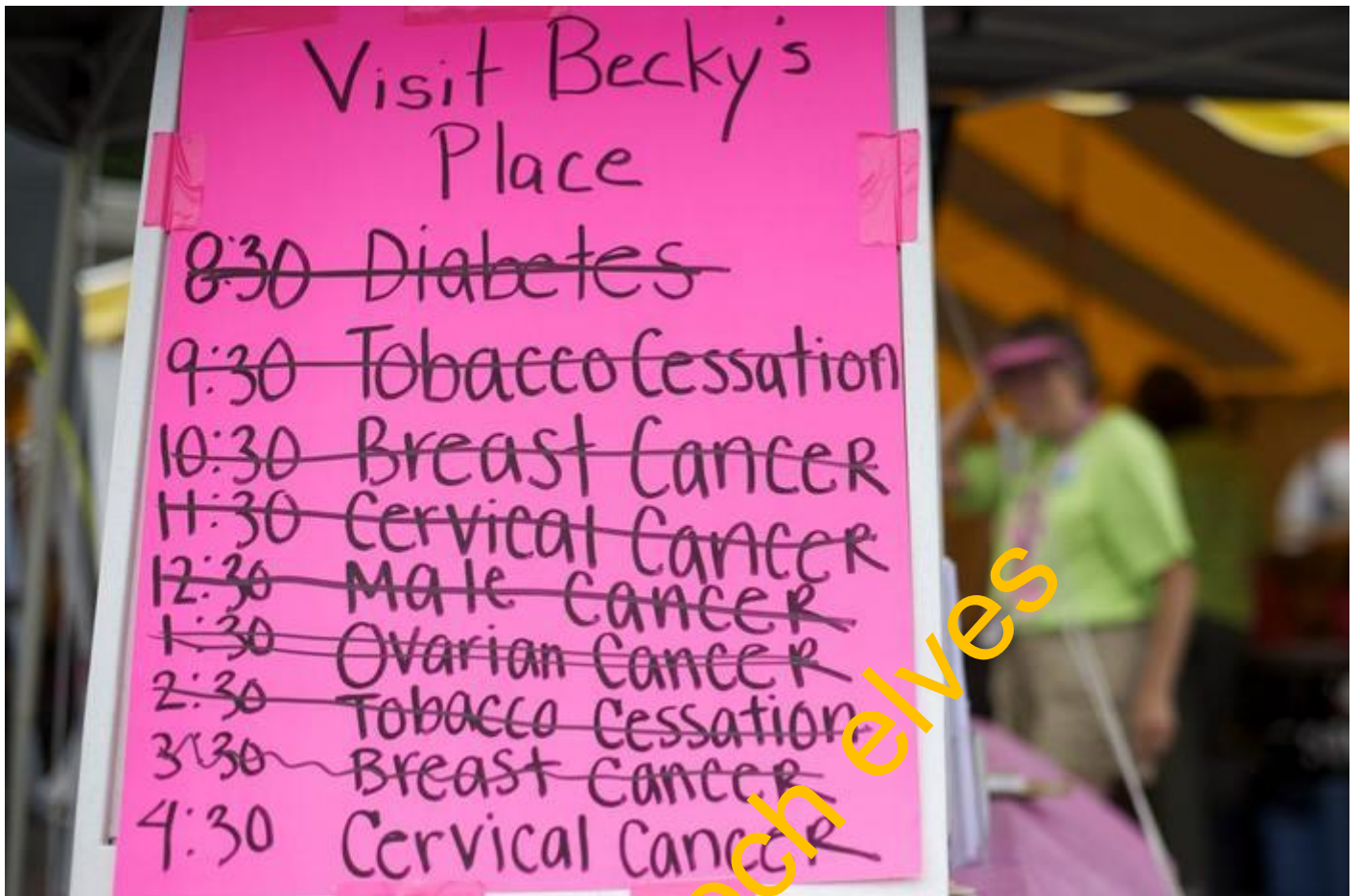
Soupis nemocí, které lze s lékaři RAM kliniky prokonzultovat.