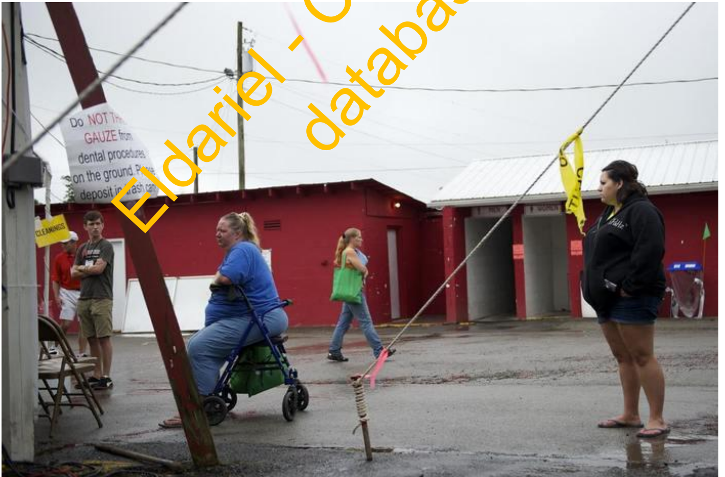
Čekají zde i za deště.