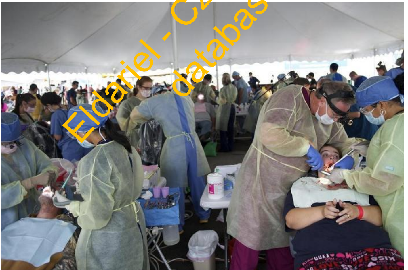
Pohled do sálu RAM kliniky. Je plný lidí. Zubaře, pracující v popředí, čeká dlouhá směna