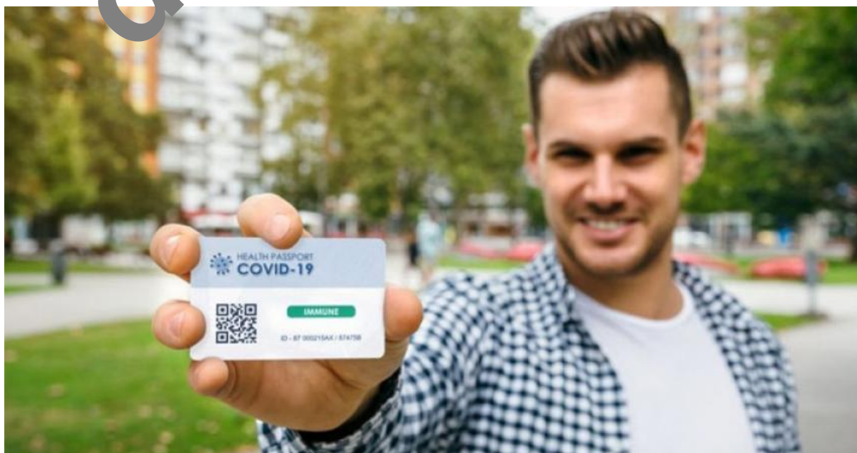
Doklad o imunitě na Covid-19. Takto by to brzy mohlo vypadat v praxi.

Celý systém by fungoval tak, že po vyléčení pacienta z nemoci Covid-19 by se informace zanesla do státní databáze, ke které by potom měly přístup všichni dopravci v Německu. Zákon také specifikoval dva základní rámce, voluntární a mandatorní. Voluntární rámec by umožňoval dobrovolně firmám využívat tuto databázi, takže zaměstnavatel v oboru strojírenství by si ověřil, kolik jeho zaměstnanců prošlo nemocí Covid-19, a kteří naopak nemocí neprošli. To by vedlo k tomu, že zaměstnavatelé budou na osoby bez imunitní karty pohlížet s podezřením, že mohou roznášet nákazu, protože ještě neprošli nemocí a nemají tudíž imunitu. Voluntární rámec zákona by se stal hlavním nástrojem zaměstnavatelů na upřednostňování lidí s imunitou.