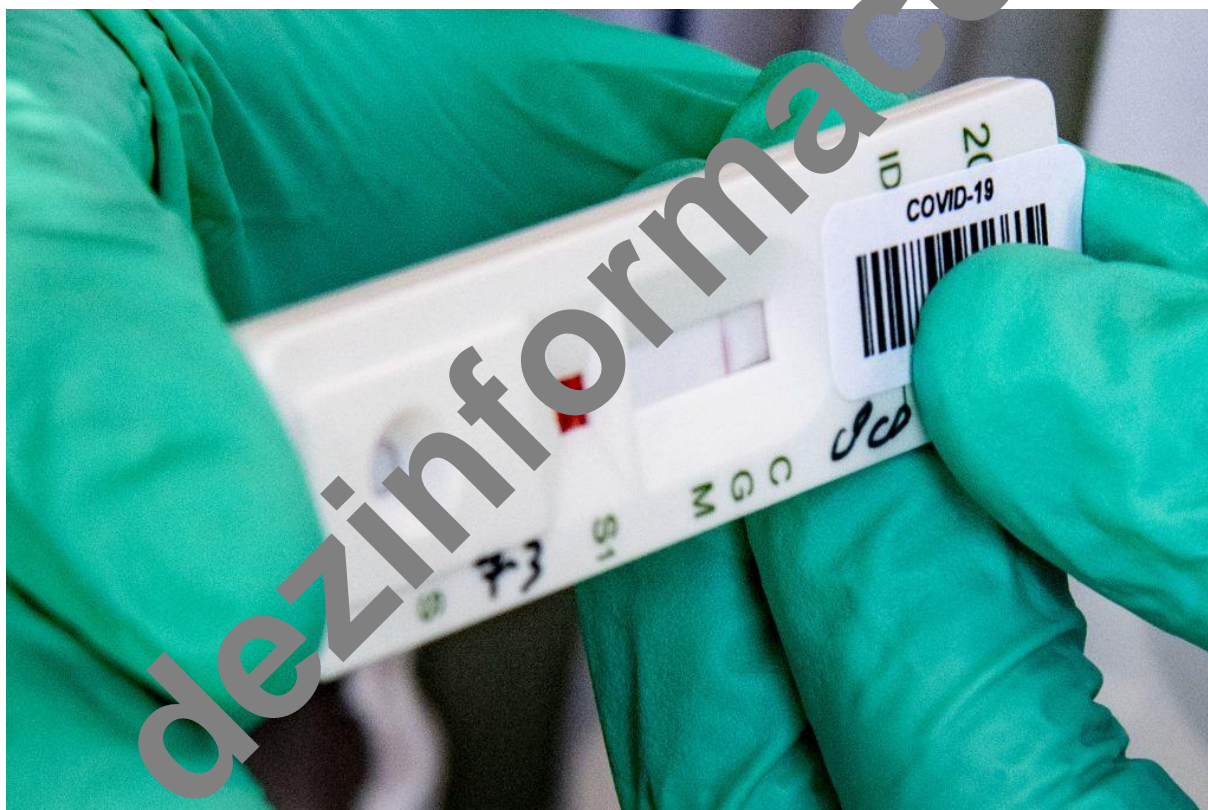
Rychlotest na Covid-19.

nakazit, “ uvedl spolkový ministr zdravotnictví Jens Spahn (CDU). Dosud taková jistota neexistuje. Zákon je tedy prý a prozatím jen preventivním nařízením. “Pokud se dospěje k závěru, že lidé jsou po prodělání nemoci imunní vůči Covid-19, potom by dokument o imunitě věcem na mnoha místech usnadnil, “ řekl Spahn. “Byla by to šance, že občané by mohli provádět určité činnosti snadněji.” Jako příklad uvedl zdravotnické pracovníky. Navrhovaný zákon uvádí, že imunita může být použita k vyvození dalekosáhlých závěrů o tom, jak zacházet s ochrannými opatřeními a zranitelnými skupinami lidí.