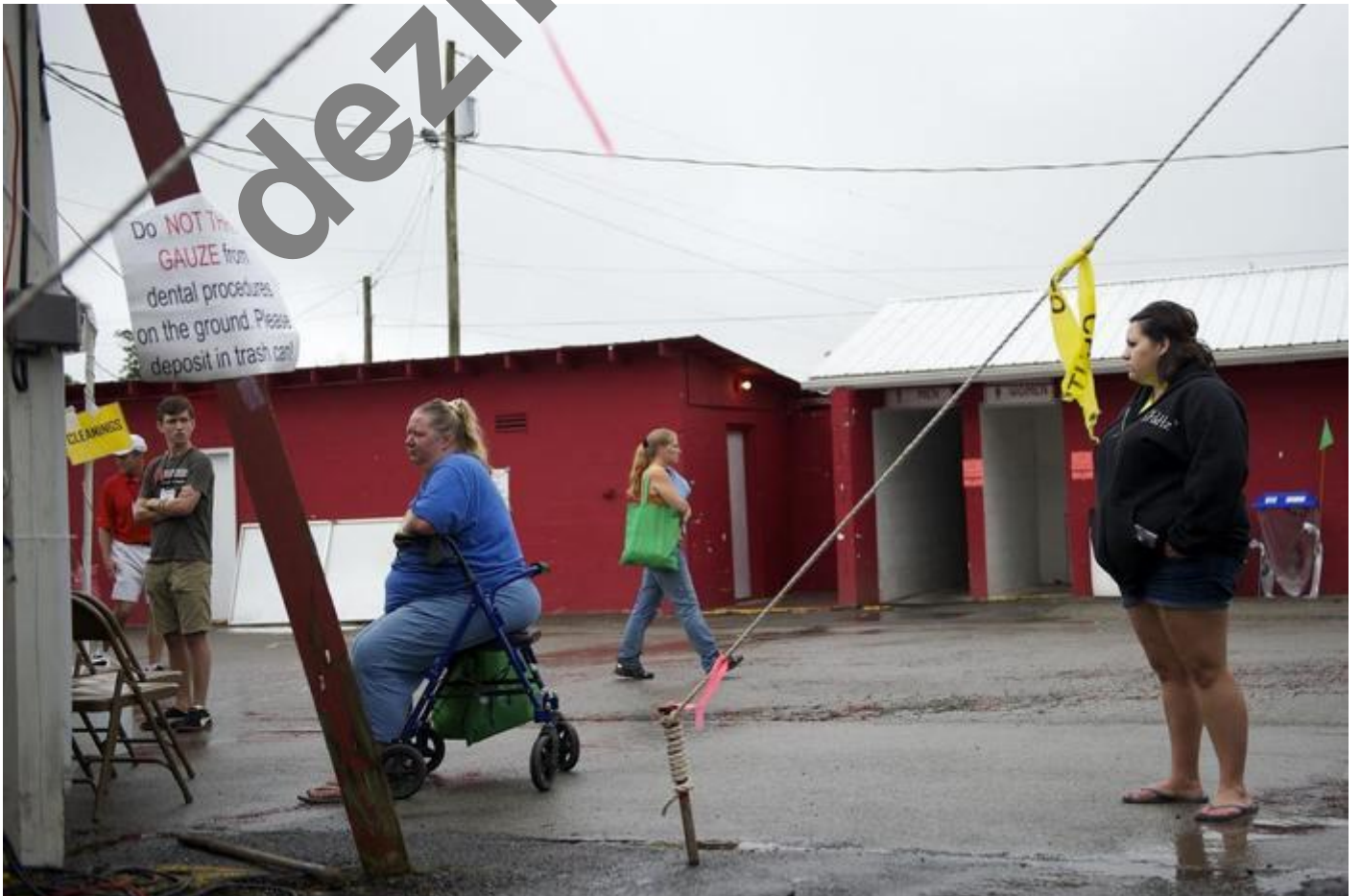
Čekají zde i za deště.