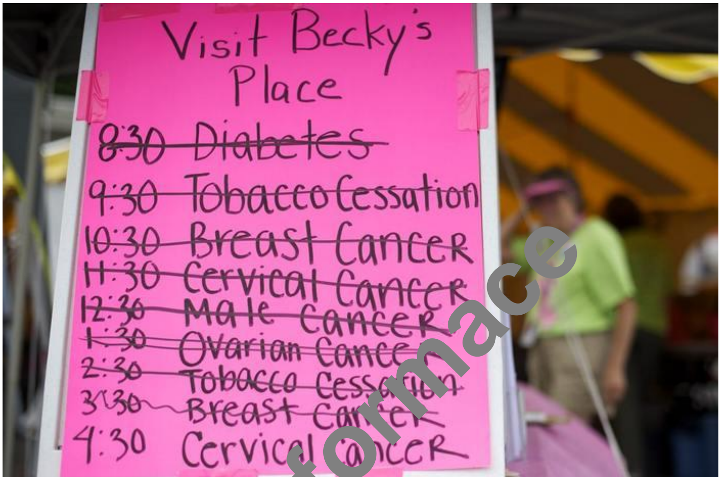
Soupis nemocí, které lze s lékaři RAM kliniky prokonzultovat.