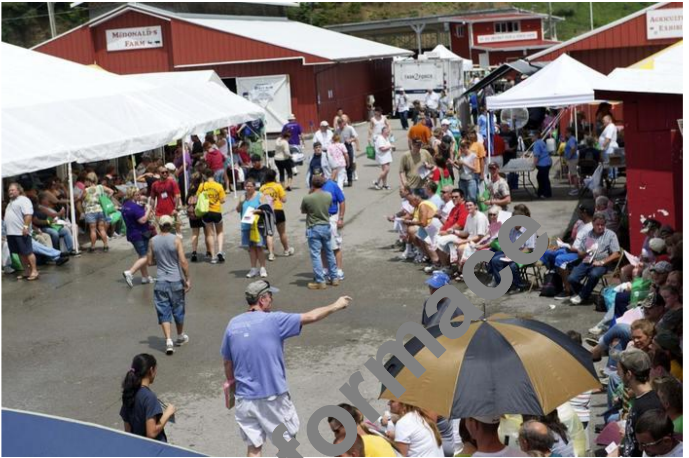
Takto vypadá prostranství před klinikou RAM. V areálu se nachází spousta lidí.