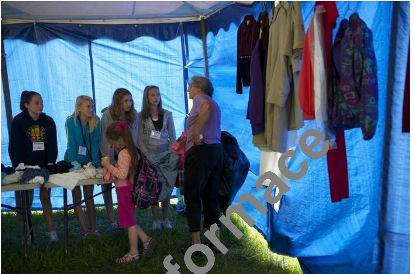
Uvnitř stanu, kde operuje personál RAM kliniky, je možné dostat zdarma i oblečení.