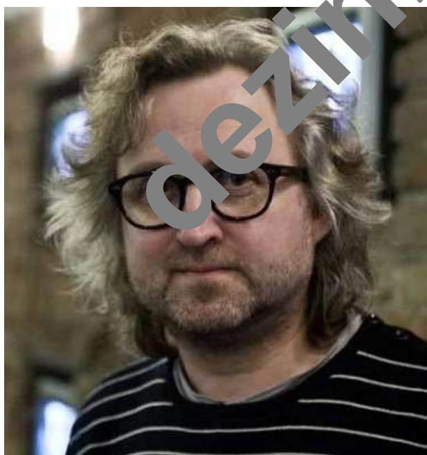
Jan Hřebejk – režisér