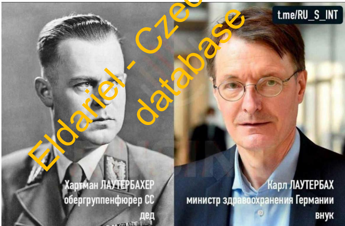
4. Karl Lauterbach - ministr zdravotnictví Německa.