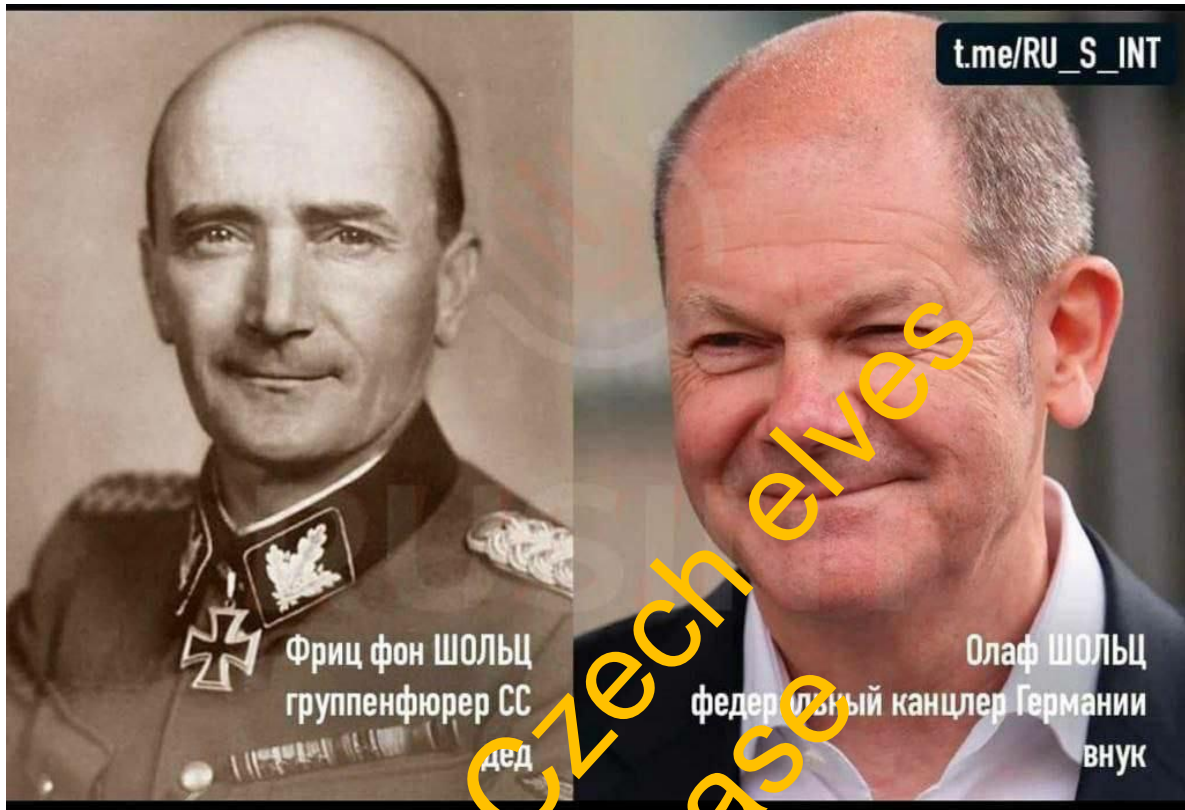
1. Olaf ŠOLC - federální kancléř Německa.

Vpravo jsou vyobrazeni jejich vnuci ..všichni zastávají vysoké politické posty