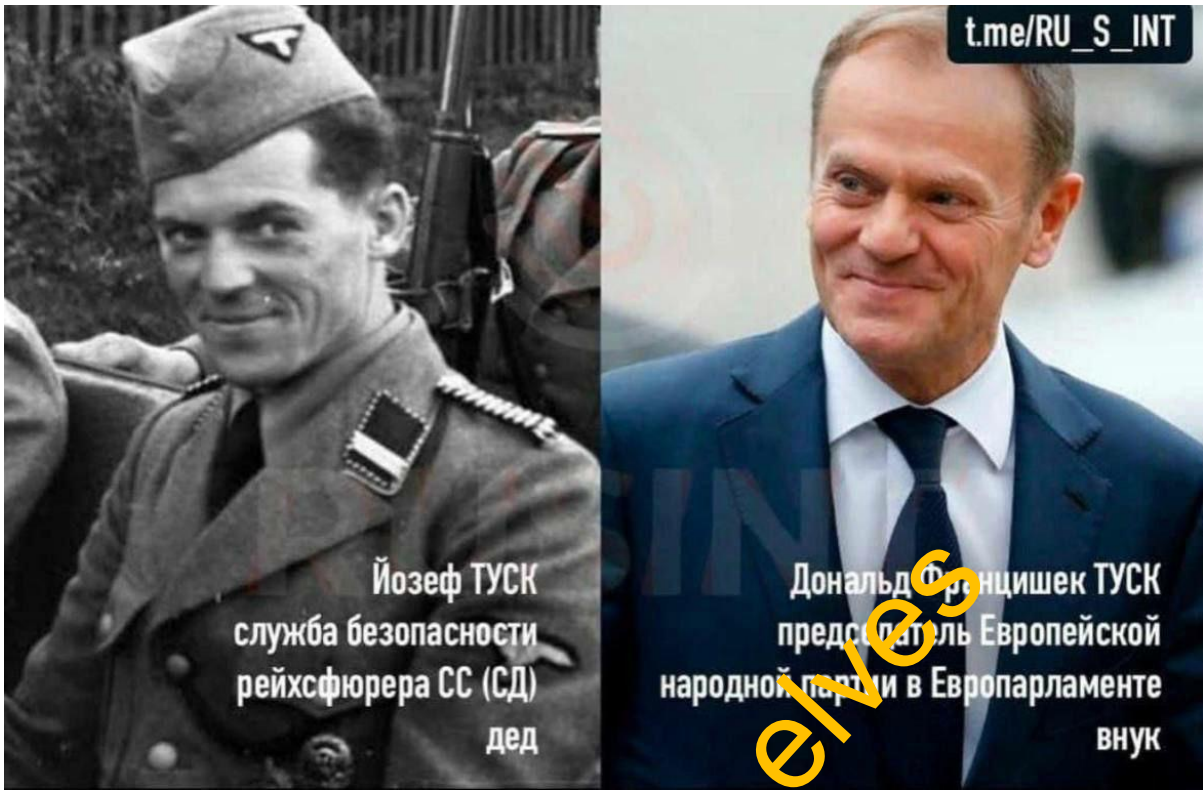
3. Donald František Tusk – bývalý předseda Evropské národní strany v parlamentu EU, možná maršálek ejmu Polska