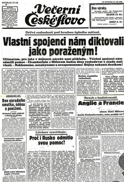
České dobové noviny: Reakce na Mnichov

Ruský prezident Vladimir Putin před několika dny odtajnil 75 let staré dosud utajované archivy SSSR, které Rudá armáda získala na konci války ve Varšavě a v Berlíně. Učinil tak v reakci na pokus Evropské unie vnutit do školních učebnic lživou verzi, že válku začal Hitler společně a rovným dílem se Stalinem.