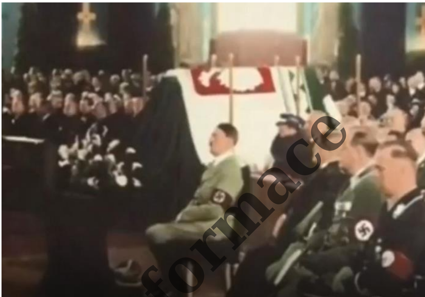
Adolf Hitler na čestném místě při pohřbu polského vůdce Pilsudského v roce 1935