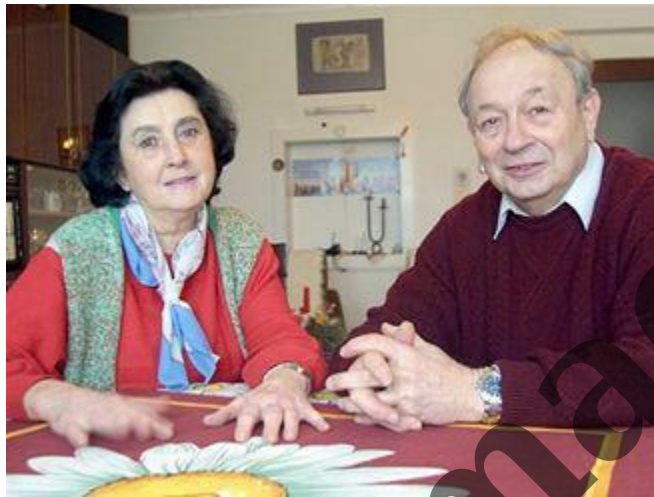
Zbyněk Čeřovský s manželkou

Zbyněk Čeřovský, politický vězeň a signatář Charty 77 od března 1977