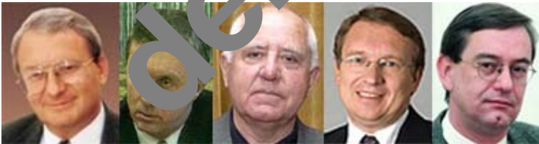
Ivan Kočárník, Jan Klak, Tomáš Ježek, Roman Češka a Jiří Skalický