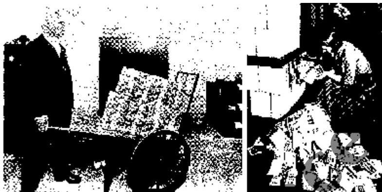
Obr. 3 a 4:

Německo ve dvacátých letech: Peníze byly bezcenné. Než za ně koupit topivo, spíše se vyplatilo je rovnou spálit.