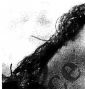
Obr. 14: Síť nanovláken.