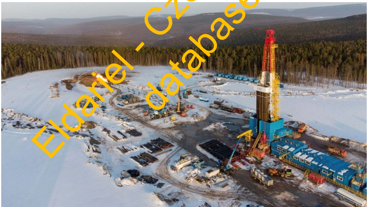
Těžební vrt zemního plyn na Sibiři

Takže jediným řešením je jaderná energie, ale ta současná nestačí. Musely by se postavit další jaderné elektrárny, desítky dalších nukleárních bloků, což by stálo biliony korun a až by byly postaveny, pořád by ještě nebylo hotovo. Někdo by totiž musel zaplatit elektrifikaci celé republiky, tedy transformaci celého státu z plynofikované země, která se od 70. let na všech úrovních plynofikovala, na stát elektrifikovaný, kdy bude potřeba všechny podniky, organizace, závody, továrny, školy, úřady, sídliště a rodinné domy vybavit elektrickými kotly namísto plynovými. Jenže, to pořád není všechno. Pořád něco chybí.