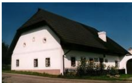
Rodný dům Adalberta Stiftera v Horní Plané