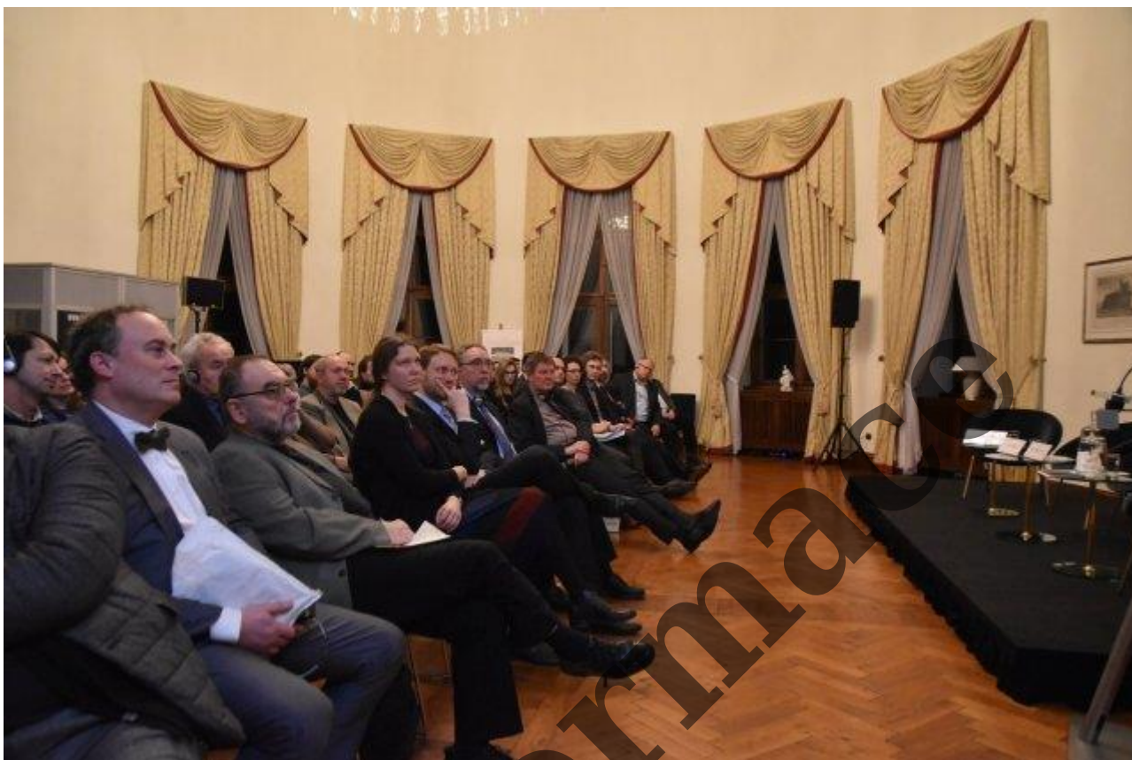
Prezentace knihy na německé ambasádě v Praze (únor 2020)

Kniha je součástí masivního německého pokusu přepsat historii. Přichází v době, kdy umírají poslední pamětníci (narození před rokem 1930). Zesílení lze očekávat zvláště letos, kdy je 75. výročí různých událostí, spojených s koncem II. světové války.