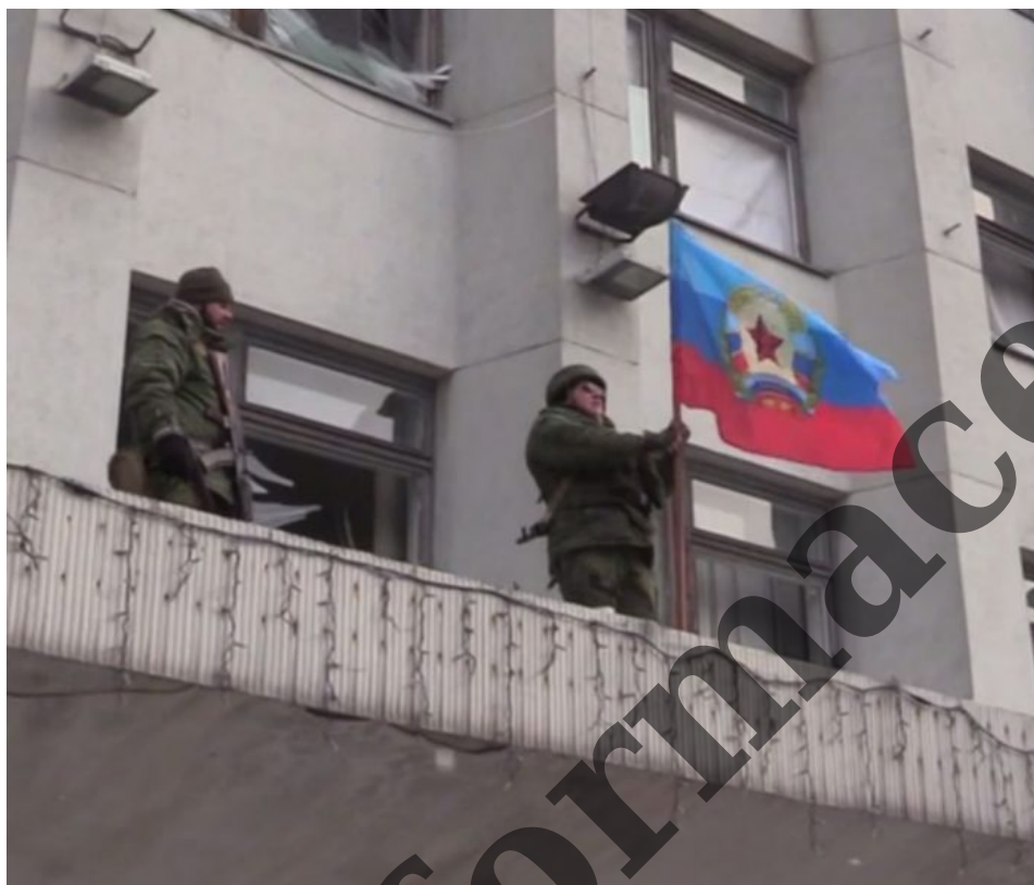
Vyvěšení vlajky osvoboditelů LLR ve městě Rubežno

kádrem, kterým měl být podle představ Berezovského a Levieva v roce 1999, ale bez Putina by Rusko skončilo a spolu s ním i Ruský židovský kongres a jeho správa nad majetky jednotného Ruska. Je to svazek z rozumu, i když svatba vypadala jinak.