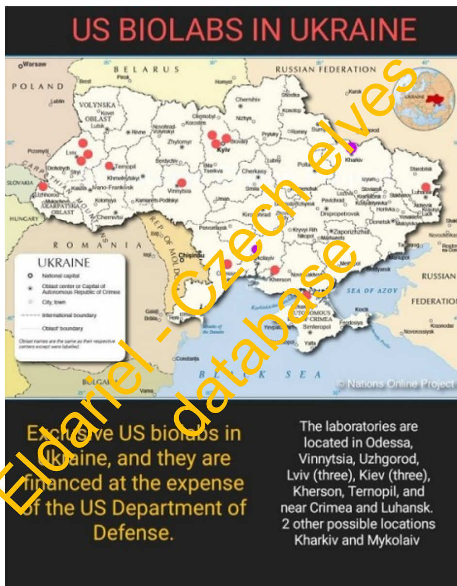
Mapa rozmístění amerických biologických laboratoří na Ukrajině

Podle britského listu The Daily Expose jde v konfliktu mezi Ruskem a Ukrajinou mimo jiné právě o biologické laboratoře, které Američané na Ukrajině mají. Podle těchto informací americká armáda na území Ukrajiny vytvořila síť biologických tajných laboratoří. V listu byla rovněž zveřejněna mapa rozmístění těchto laboratoří po celé zemi.