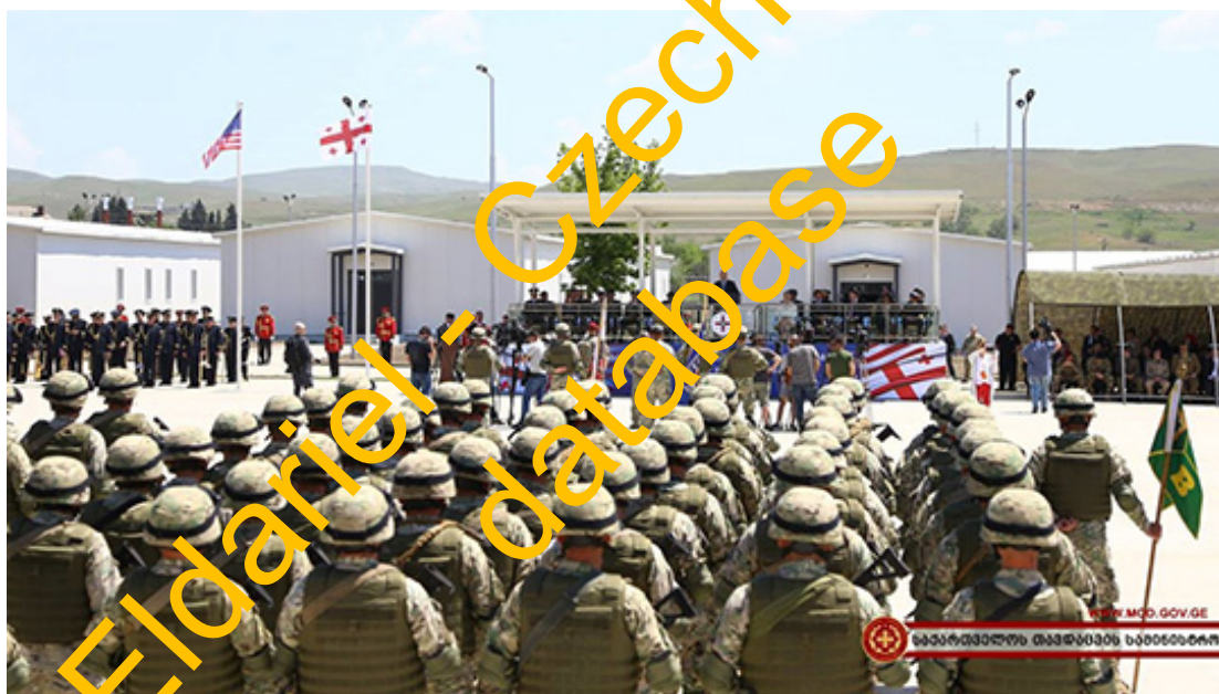
Americká základna v gruzínském Tbilisi, kde se nachází biologická laboratoř Pentagonu

Jedna z laboratoří se nacházela také severně od Luhanska na území ovládaném ukrajinskou armádou, které je už dnes pod kontrolou domobrany LLR. Jedno z biologických pracovišť bylo i na území poblíž Krymu, které je od prvních dní operace rovněž pod kontrolou Moskvy a jejich spojenců. Kromě Ukrajiny měla americká armáda laboratoře pro výrobu biologických zbraní také v dalších zemích bývalého sovětského svazu, které dnes spolupracují se Západem. Jedna z největších byla v gruzínském Tbilisi. Už před časem byly tyto informace zveřejněny nezávislými žurnalisty, což vyvolalo v Pentagonu velkou nelibost.