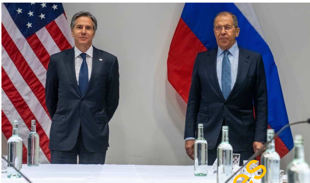
Jednali 21. ledna v Ženevě Blinken a Lavrov i o biologických zraních na Ukrajině?

Podle určitých indicií byla Moskva prostřednictvím svých tajných služeb informována, jak daleko je Pentagon s přípravou biologického útoku na Rusko prostřednictvím ukrajinských laboratoří. V prosinci se v médiích objevují informace o chystaném chemickém a biologickém útoku na Doněck. Rusko údajně dalo Washingtonu na stol 17. prosince ultimátum, že pokud nebude příprava útoku zastavena a biologické laboratoře z Ukrajiny staženy, vyhrazuje si Moskva, vyřešit tuto záležitost silou.