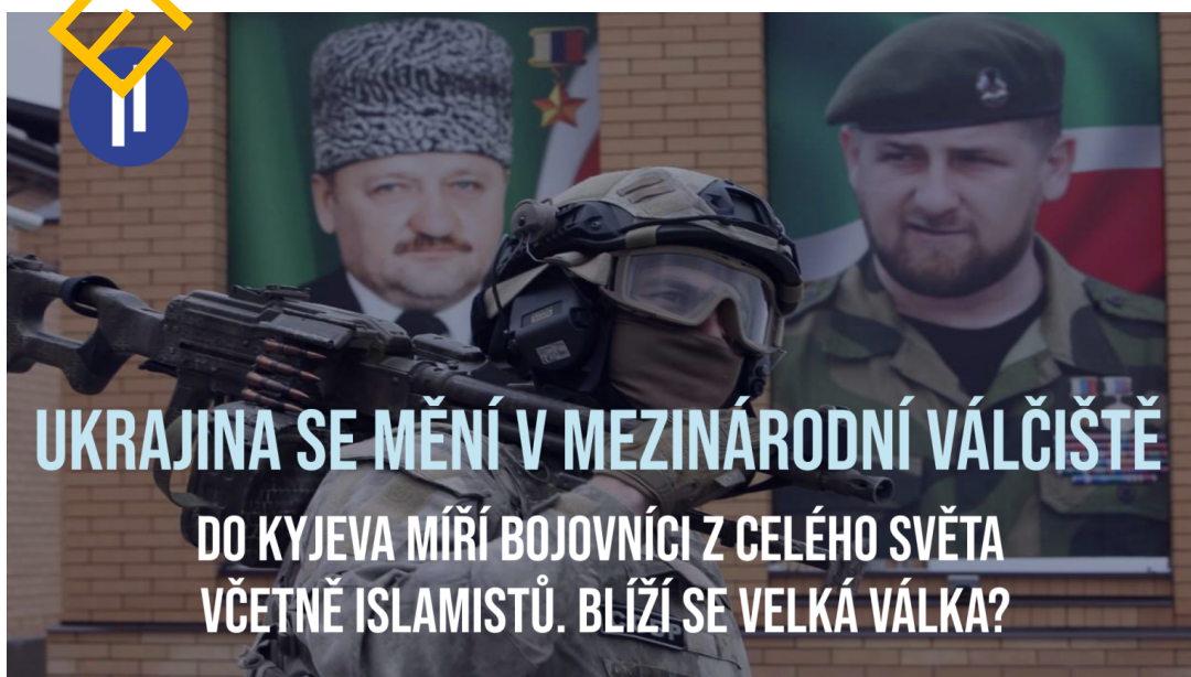
Ukrajina se mění v mezinárodní válčiště. Do Kyjeva míří bojovníci z celého světa

Po deseti dnech konfliktu na Ukrajině se objevují stále nové informace, co mohlo být spouštěcím momentem ruské vojenské operace. Oficiální oznámení Kremlu o tom, že se jedná o „demilitarizační“ a „denacifikační“ operaci, může mít hned několik vysvětlení. Odpověď bychom mohli hledat především v průběhu samotné vojenské operace.