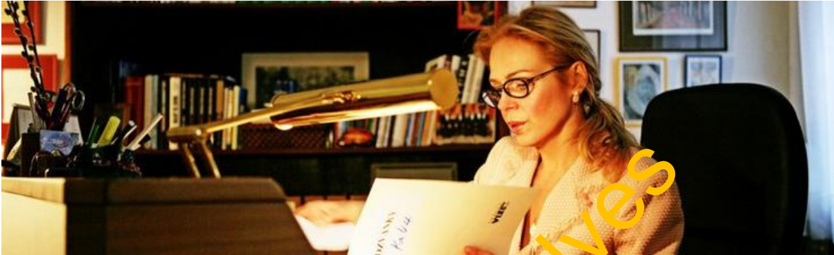
Obr. Dagmar při práci pro rapaci Vize 97

Mimochodem, ten Thaci, kterého jako bojovníka za svobodu Západ prosadil do čela, dnes již definitivně zhroutěného Kosova, konečně čelí soudu. Rozhodujícím zdrojem rozvratu byla nelegitimní a naprosto vyhlaná válka v Iráku. Ta odstranila sekulárního autoritativního předáka Husajna a odstartovala proces celkového rozvratu celého středního Východu.