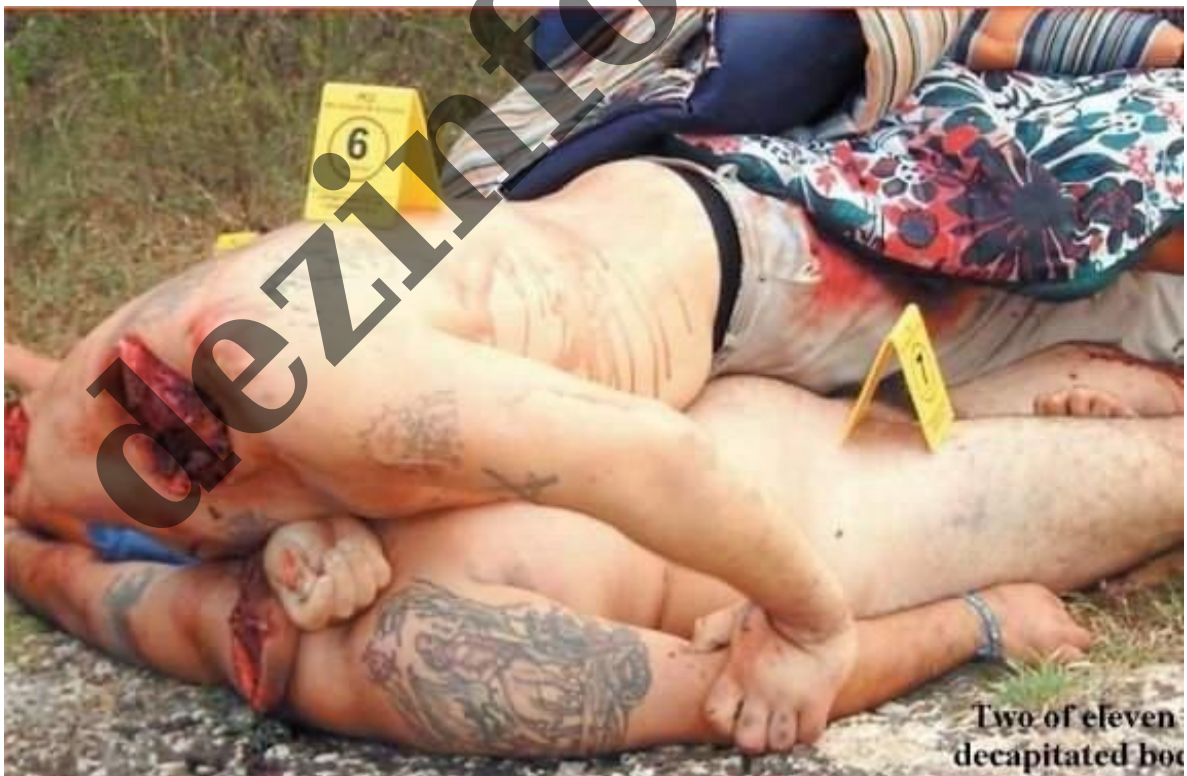
Pravý sektor usekává hlavy, VRAŽDÍ, PONIŽUJE, ZNÁSILŇUJE, LOUPÍ