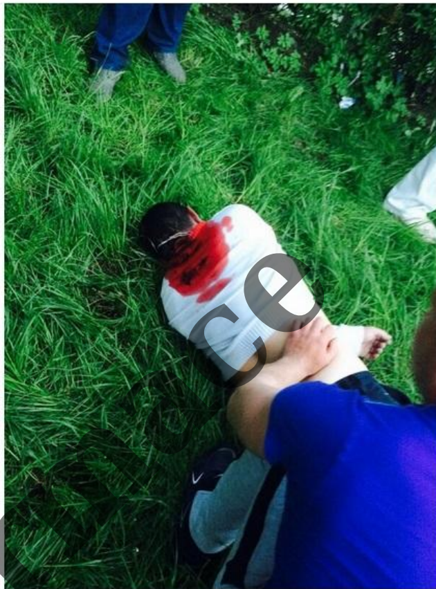
UKROVSKÉ VRAŽDY, V TOM JSOU BORCI