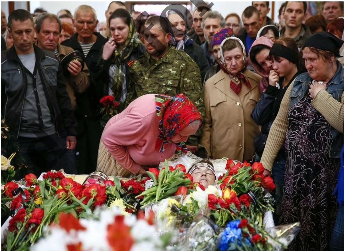
Kyjevská vláda zasévá nenávisť lidí ve východní Ukrajině k západní Ukrajině