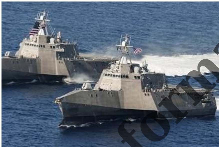
Americké válečné lodě

Na ukrajinském Očakovu, který se nachází v těsné blízkosti Krymu, začala výstavba americké námořní základny, připomíná švýcarské vydání InfoSperber.