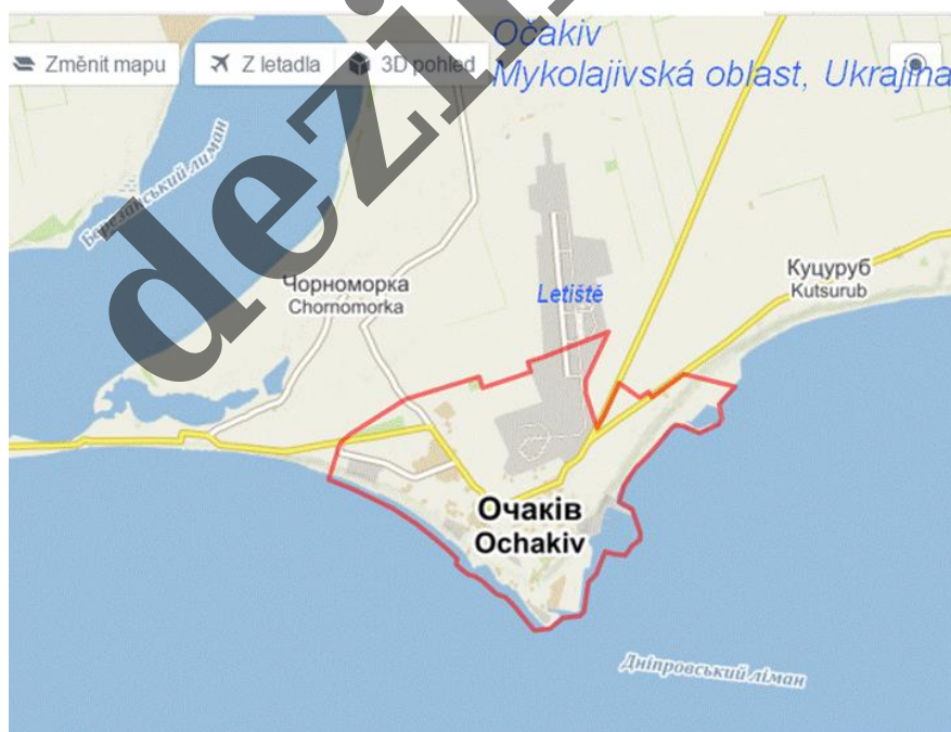
Ukrajina: Očakovo - Americká vojenská námořní základna v Černém moři