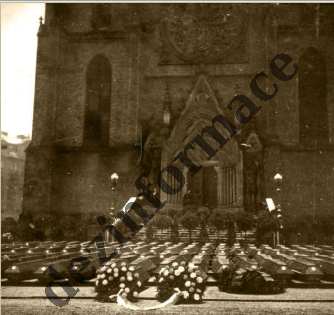
Rakve po americkém bombardování před kostelem sv. Ludmily na náměstí Míru

Čtrnáctého února byla popeleční středa (první den postní doby) a podle americké tradice je ten den i svátek zamilovaných – svatý Valentýn. Tento den se v roce 1945 zapsal do dějin Prahy jako “Krvavá popeleční středa”, nebo “Krvavý Valentýn”. Zahynulo 701 obyvatel Prahy, více než tisíc bylo zraněno.