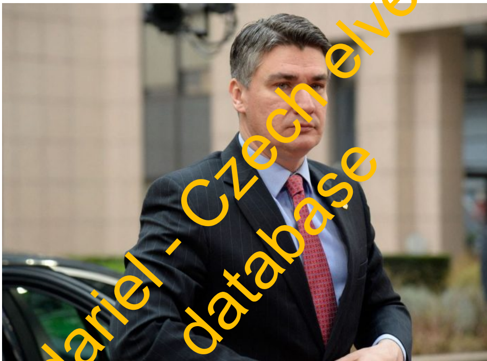
Chorvatský prezident Zoran Milanović

A je to tady, NATO se začíná drolit a štěpit, jako první to prasklo v Záhřebu a v Bruselu byla večer svolána mimořádní schůzka velitelů NATO, aby situaci vyhodnotili. Chorvatský prezident Zoran Milanović vystoupil v televizi v mimořádném projevu a obvinil [1] americkou vládu Joea Bidena z eskalace bezpečnostní situace v Evropě s cílem odvést pozornost v USA od domácí politické krize a brutálního propadu důvěry americké veřejnosti v Kongres a v prezidenta Joea Bidena. Poradci Bílého domu proto měli prezidentovi doporučit odvedení pozornosti mimo území USA a vyvolání bezpečnostní krize v Evropě , což povede k převedení pozornosti americké veřejnosti jinam, k bezpečnostní hrozbě a americký kongres i prezident si tak budou moci napravit preference, což je naprosto klíčové pro přežití Demokratické strany po volbách letos na podzim.