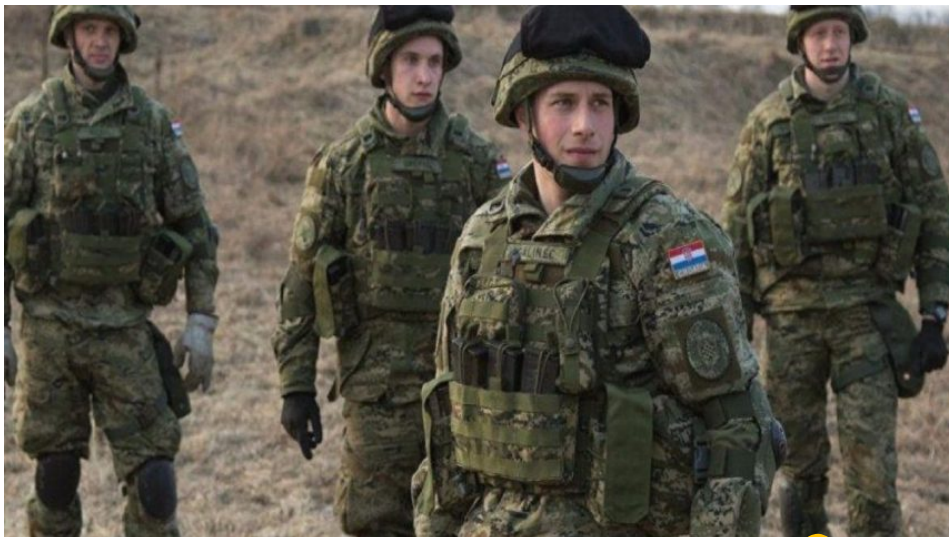
Vojáci chorvatské armády během cvičení NATO

Chorvatský prezident je proto lakmusovým papírkem, který byste neměli brát na lehkou váhu. Pokud prezident členské země NATO vystoupí v televizi a varuje, že stáhne vojáky z NATO, pokud Američané vyprovokují válku s Ruskem, tak to znamená, že Američané se už rozhodli a myslí to vážně. Americký Deep State je v koncích v USA a hrozí mu porážka v podzimních volbách do Kongresu a Senátu, a tak je připraven zavrtět válečným psem v Evropě a uvrhnout Evropu do válečného ohně stejně, jako George W. Bush stejným psem uvrhl do války nejprve Afghánistán, Irák a posléze Arabským jarem celou severní Afriku a Blízký Východ, i když v tom už pokračoval po Bushovi Barack Obama.