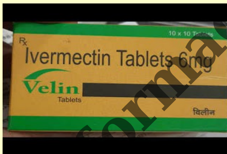
Foto: Proč Indie, "země parazitárních onemocnění", jako jedna z prvních schválila Ivermectin jako lék proti COVID-19?

Viz: COVIDgate: It's obviously a parasite, not a coronavirus. (COVIDGATE: Je to evidentně parazit, nikoli virus.)