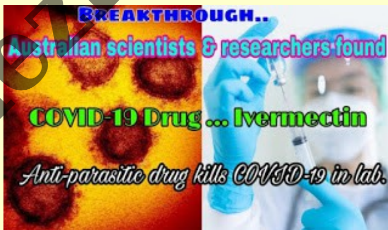
Foto: Průlom: australské vědci a badatelé našli lék proti COVIDu-19 ... Ivermectin.

Co dál? Mezi parazitem a virem je OBROVSKÝ rozdíl. A bioinženýři to věděli: proto je detailně zkonstruovaná tajná biologická zbraň Covid tak extrémně nebezpečná.