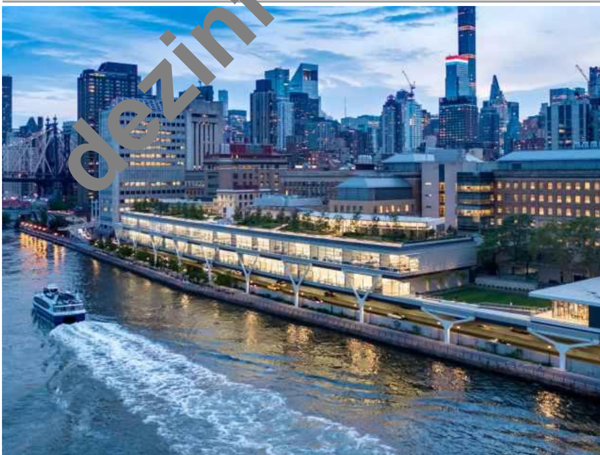
Rockefellerova univerzita v New Yorku