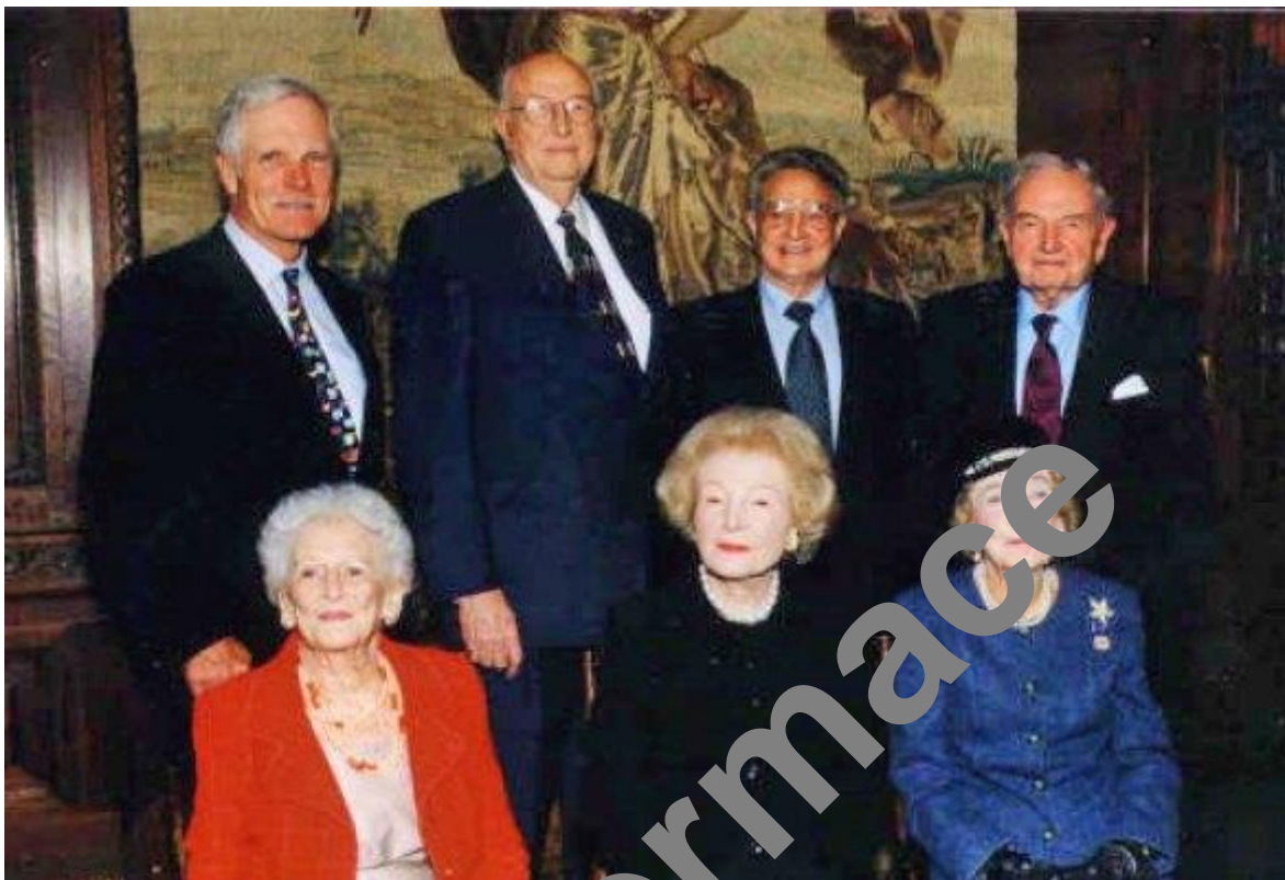
Zleva: Ted Turner, otec Billa Gatese. George Soros a David Rockefeller. Snímek je z předávání medailí za filantropii z roku 2001.