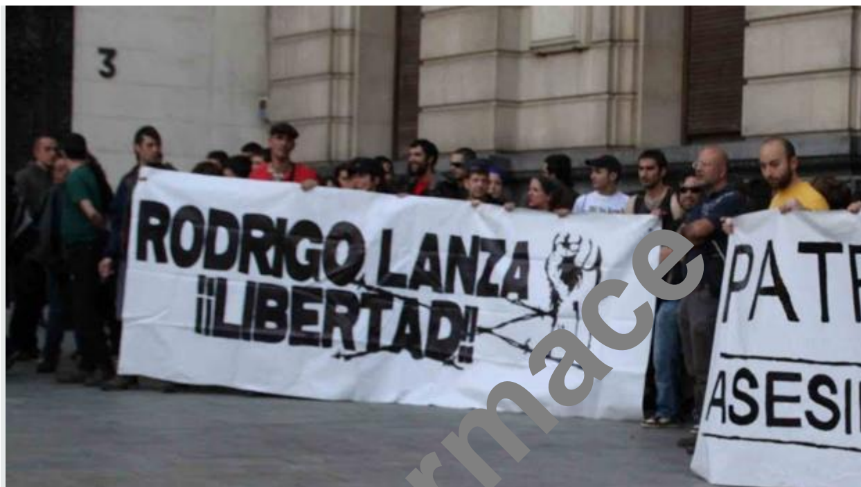
Ve Španělsku ultralevice pořádá demonstrace za propuštění vraha Lanzy.