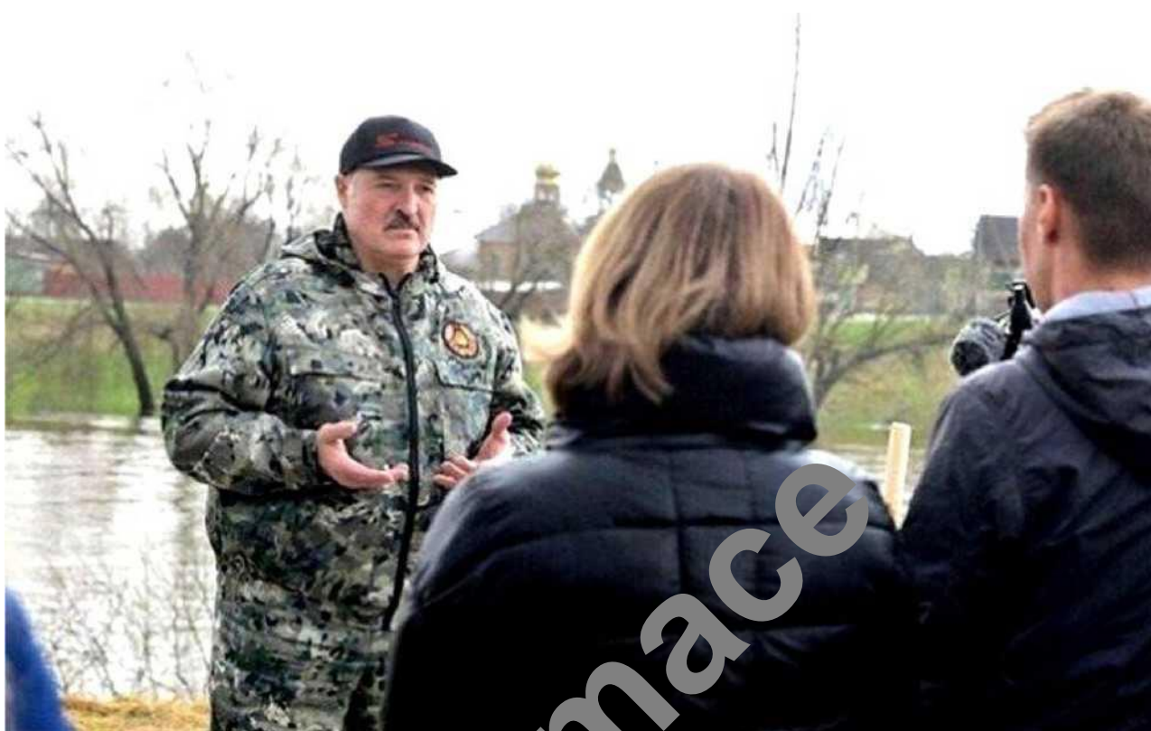
Lukašenko při rozhovoru s novináři

Běloruská KGB podle ruských novinářů zachytila komunikaci mezi monitorovaným telefonem jednoho z již delší dobu sledovaných assetů CIA v Praze, který je na pozici pracovníka amerického zastupitelství v Praze a telefonoval v sobotu v odpoledních hodinách několika lidem z okolí vlády ČR následně i několika kontaktům na vnihu a rovněž několika soukromým osobám přes mobilní aplikaci Viber.