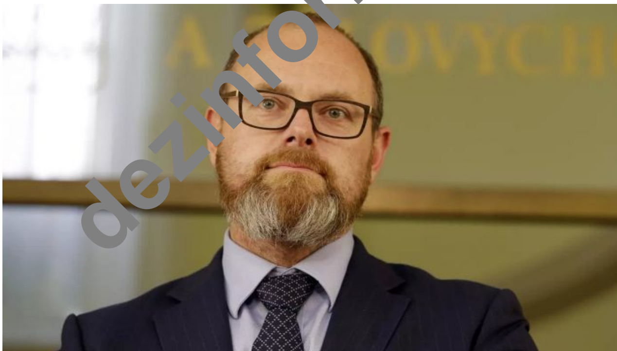
Robert Plaga, ministr školství

Rovněž i slovenské se děti se budou muset nechat 2x týdně testovat antigenními testy. A v tomto stavu hysterie se stalo v ČR něco, co je naprosto děsivým potvrzením kopírování brutálních procesů z USA do Evropy. Ministerstvo školství totiž vydalo revizi Rámcových vzdělávacích programů (RVP), tedy školních osnov pro základní školy, a to takovým způsobem, že to vyvolá naprostá šok u stovek tisíc učitelů v ČR. Jak nám do redakce napsala jedna z učitelek, české osnovy se začínají plánovat a liberalizovat.