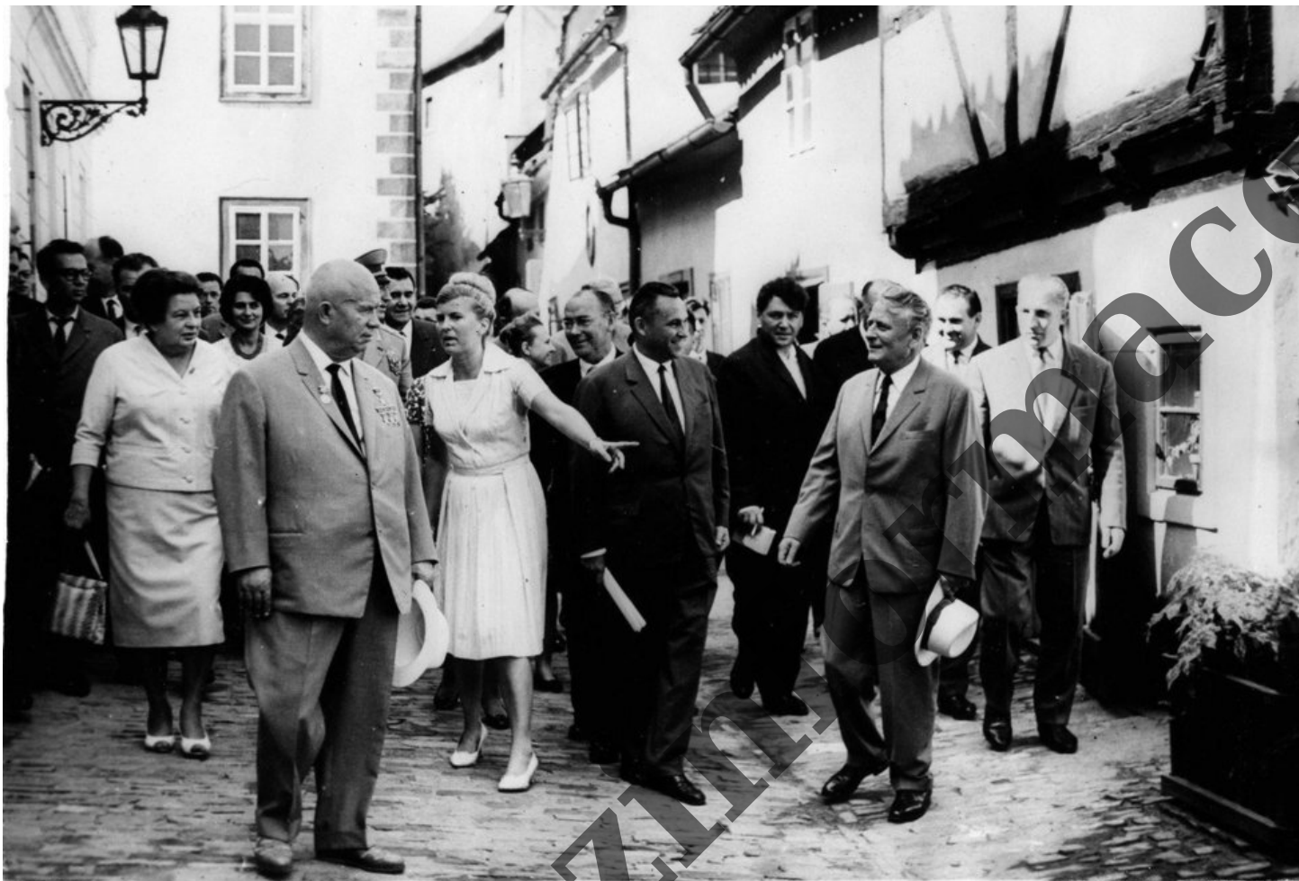
Září 1966, pražané a Nikita Chruščov