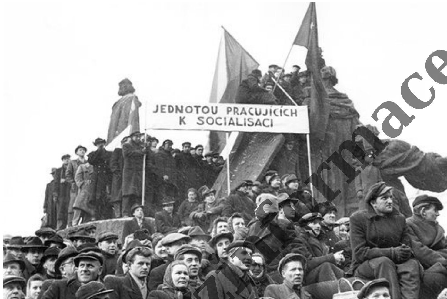
Pražané slaví Vítězný únor 1948