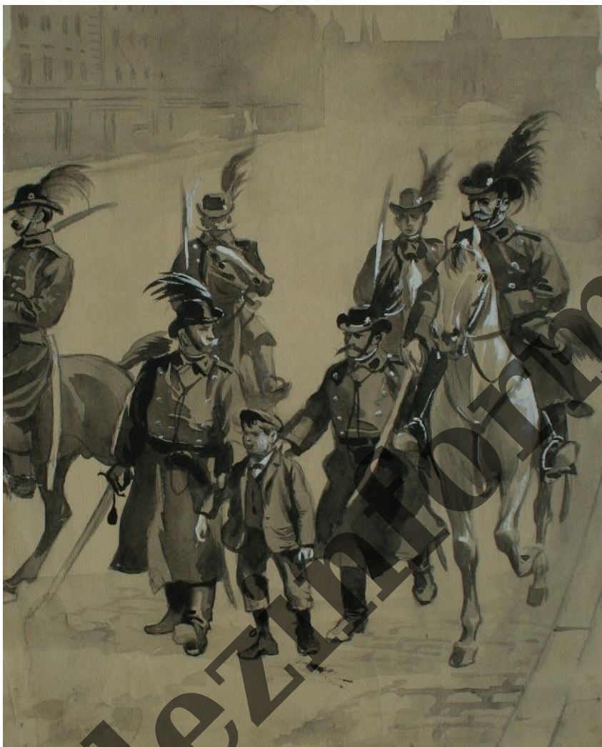
Demonstrace v Praze 1897