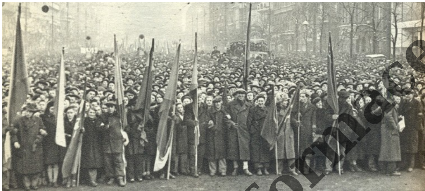
Pražané slaví Vítězný únor 1948...