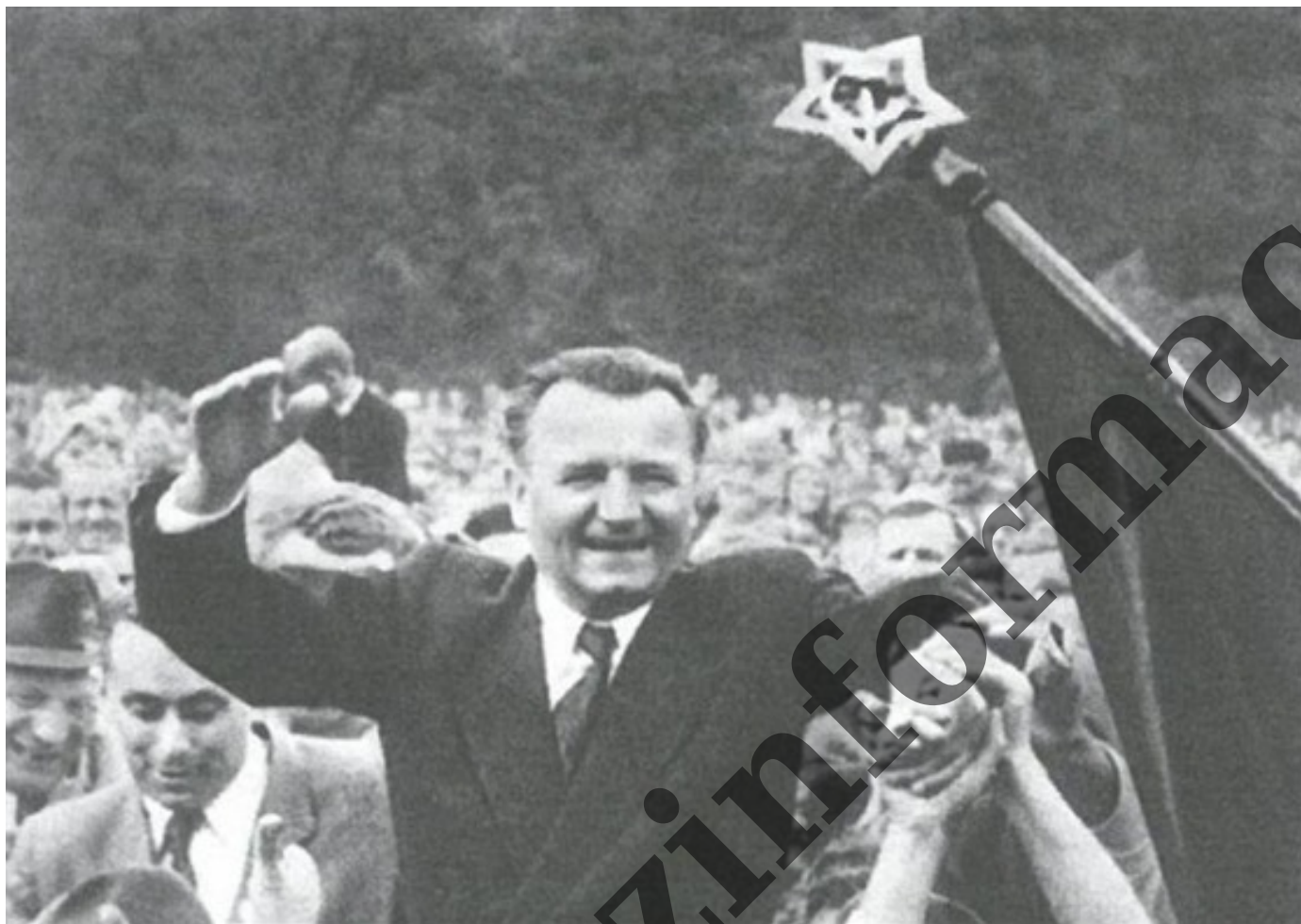
Klement Gottwald jako oblíbený předseda československé vlády v roce 1946