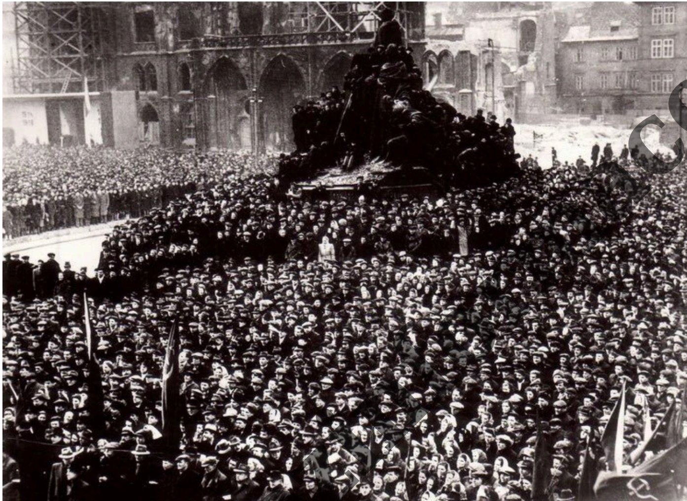
Staroměstské náměstí, pražané slaví Vítězný únor 1948.