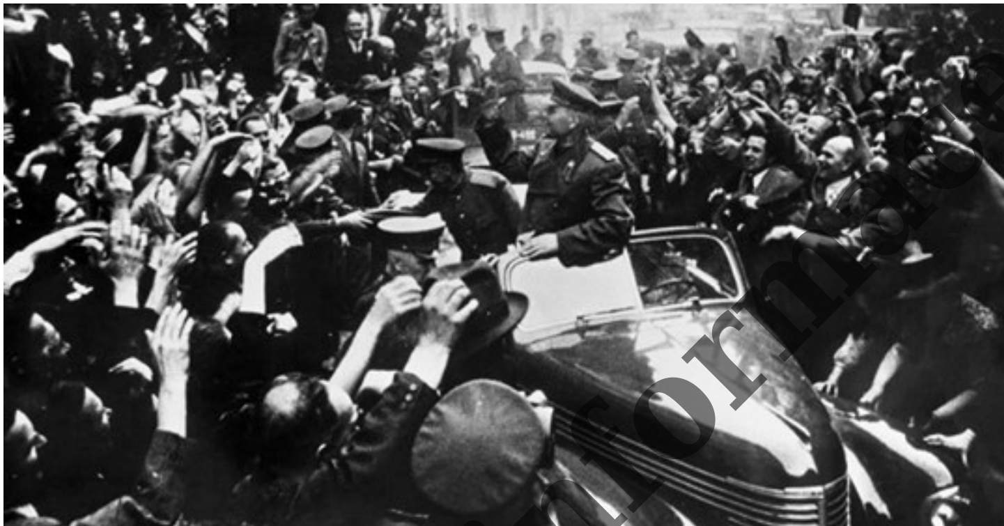
Maršál Koněv v Praze... a jeho pražané.