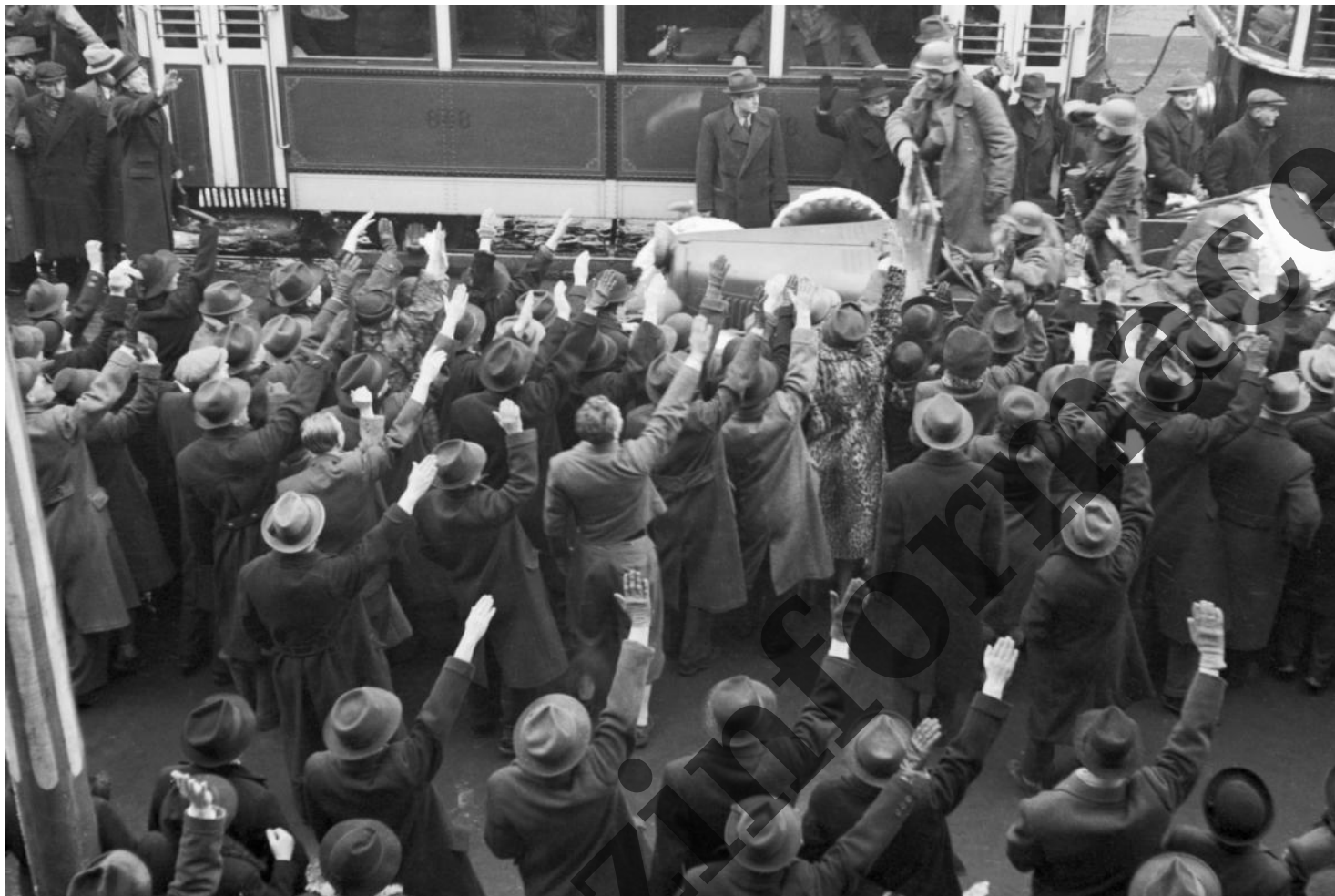
Výmluvné obrázky pražských ulic z 15. března 1939.