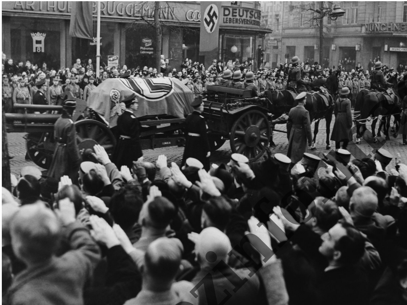
Reinhard Heydrich - rozloučení pražanů s katem...