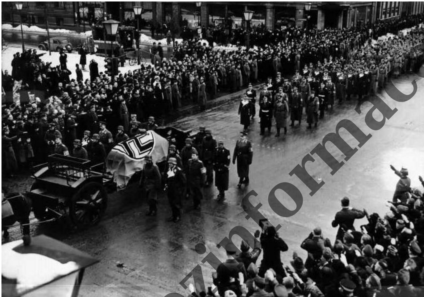
Reinhard Heydrich - rozloučení pražanů s katem...