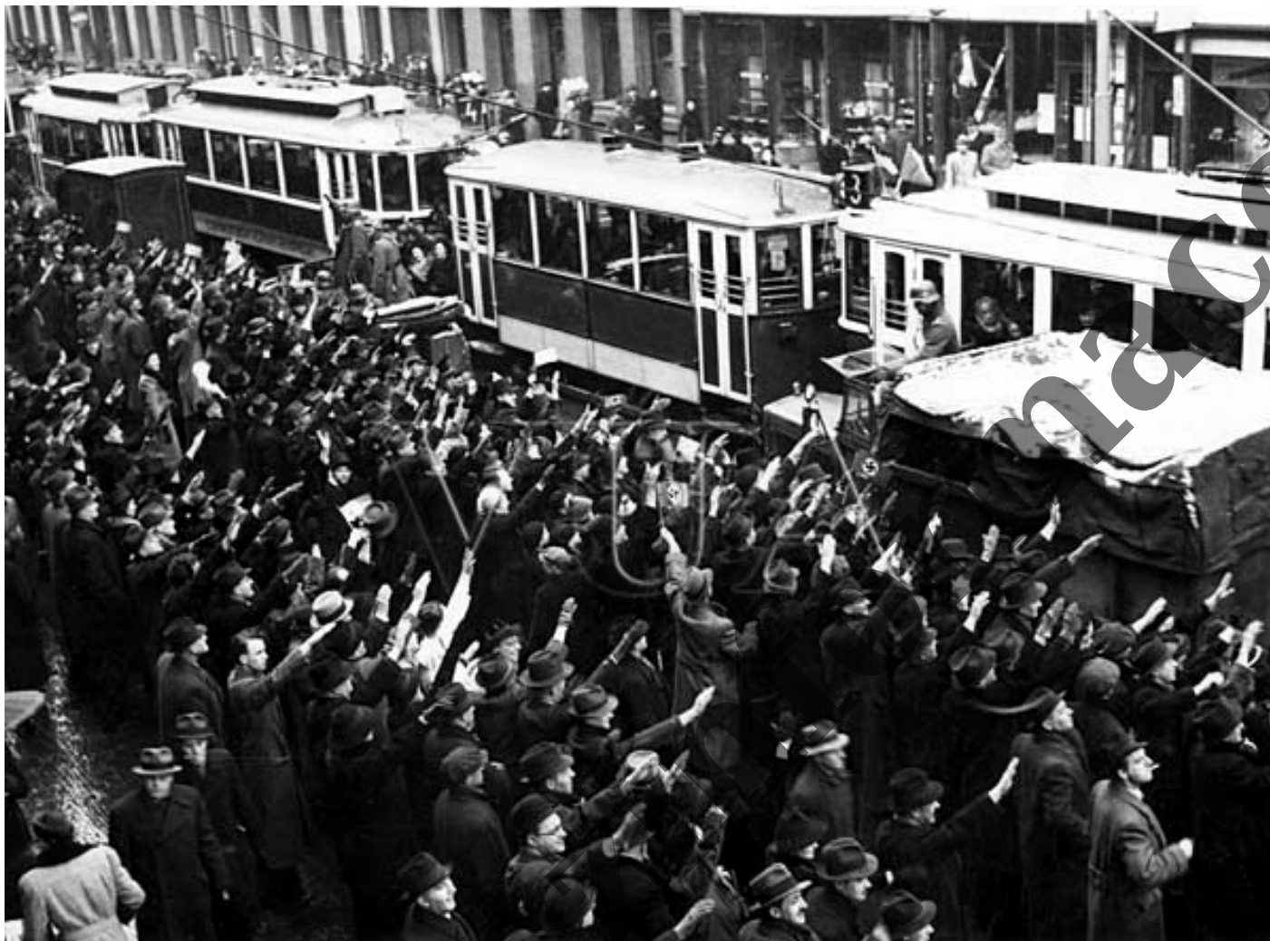
Výmluvné obrázky pražských ulic z 15. března 1939.