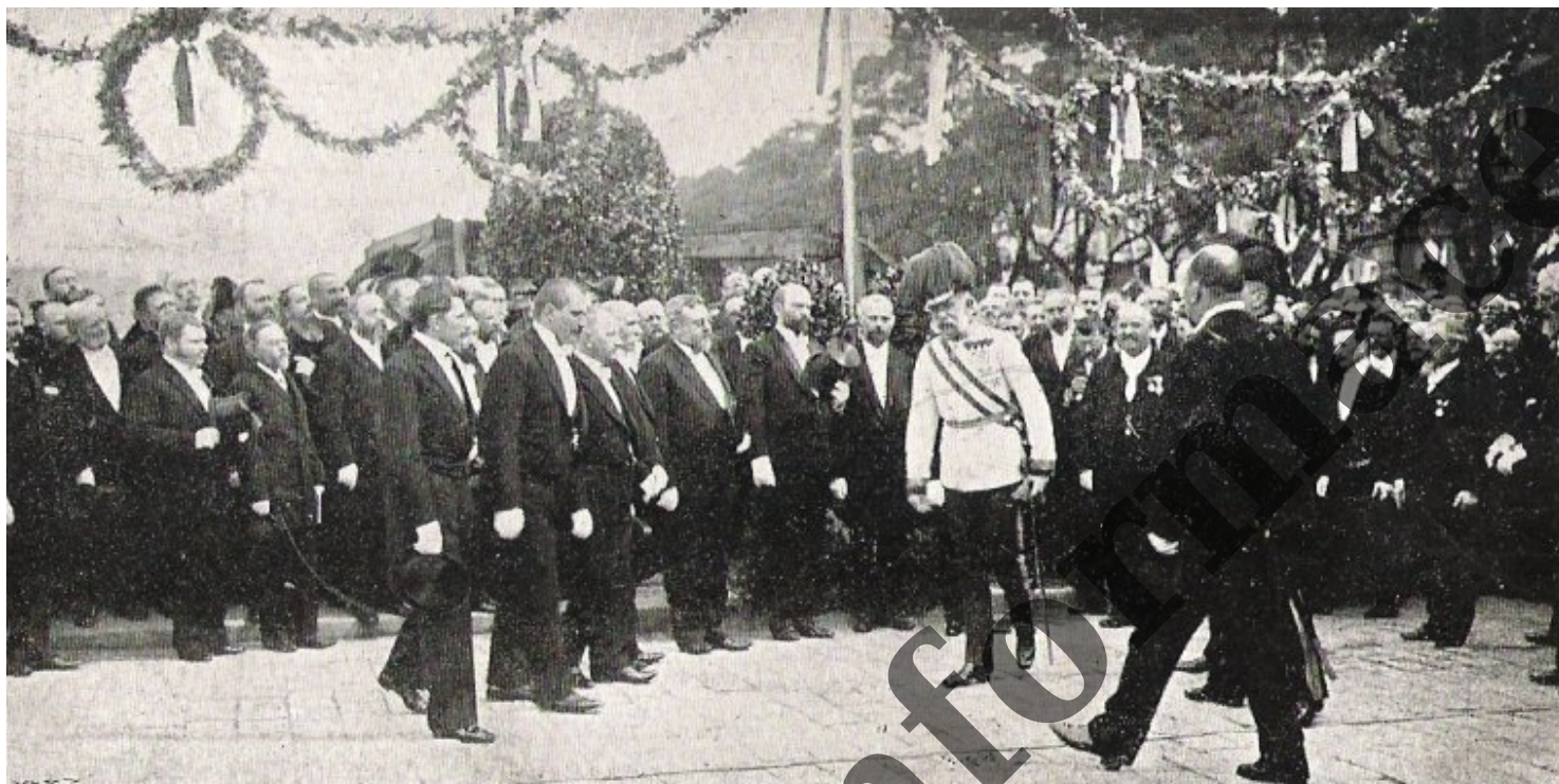
František Josef II a jeho přivítání pražany...