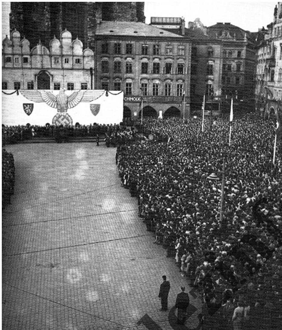
Manifestace na Staroměstském náměstí v Praze 2. června 1942