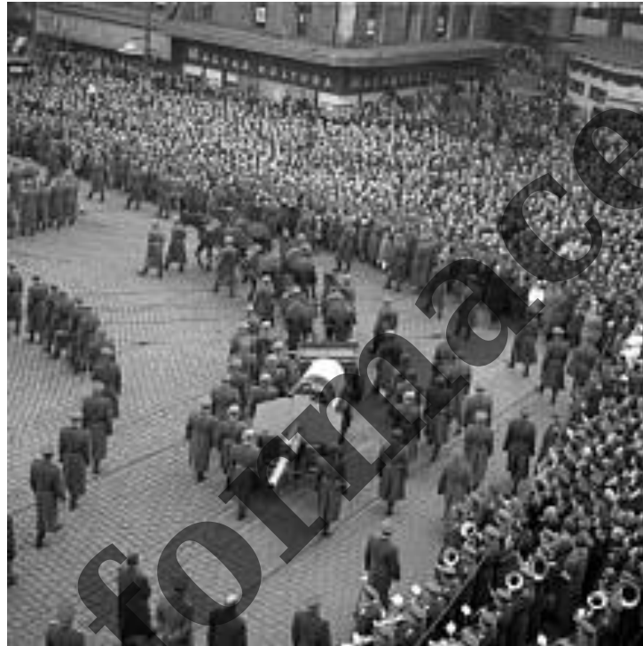
Klement Gottwald Úmrtí: 14. března 1953, pražané se loučí...