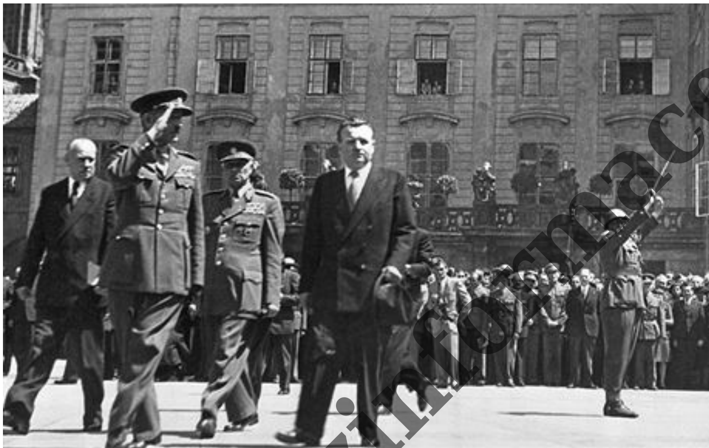
Gottwald na Hradě