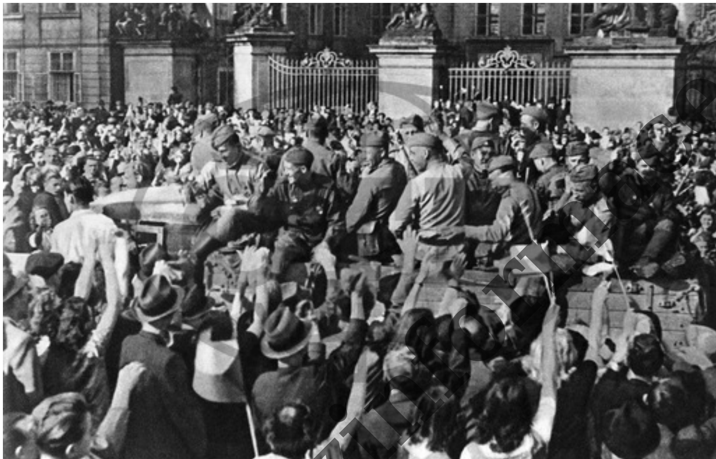
Praha, Hradčanské náměstí, Rudá armáda, sovětští, ruští vojáci, osvobození, vítání...