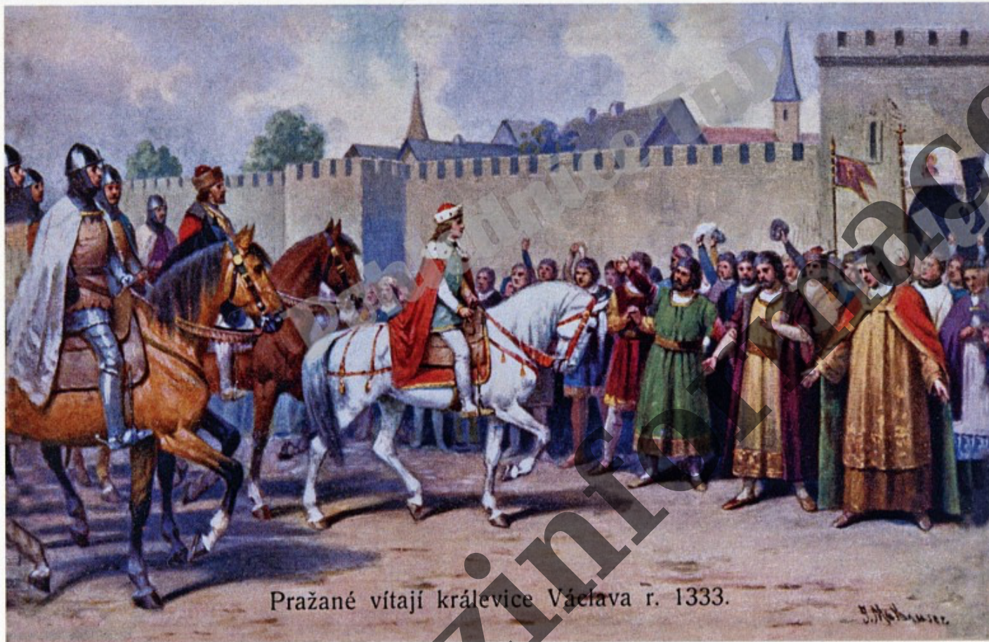
Pražané vítají krále Václava r. 1333.