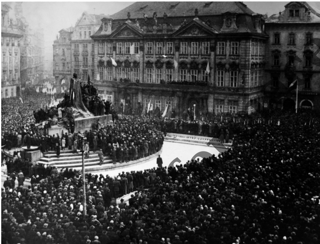
Projev Klementa Gottwalda poté, co dvanáct ministrů rezignovalo...