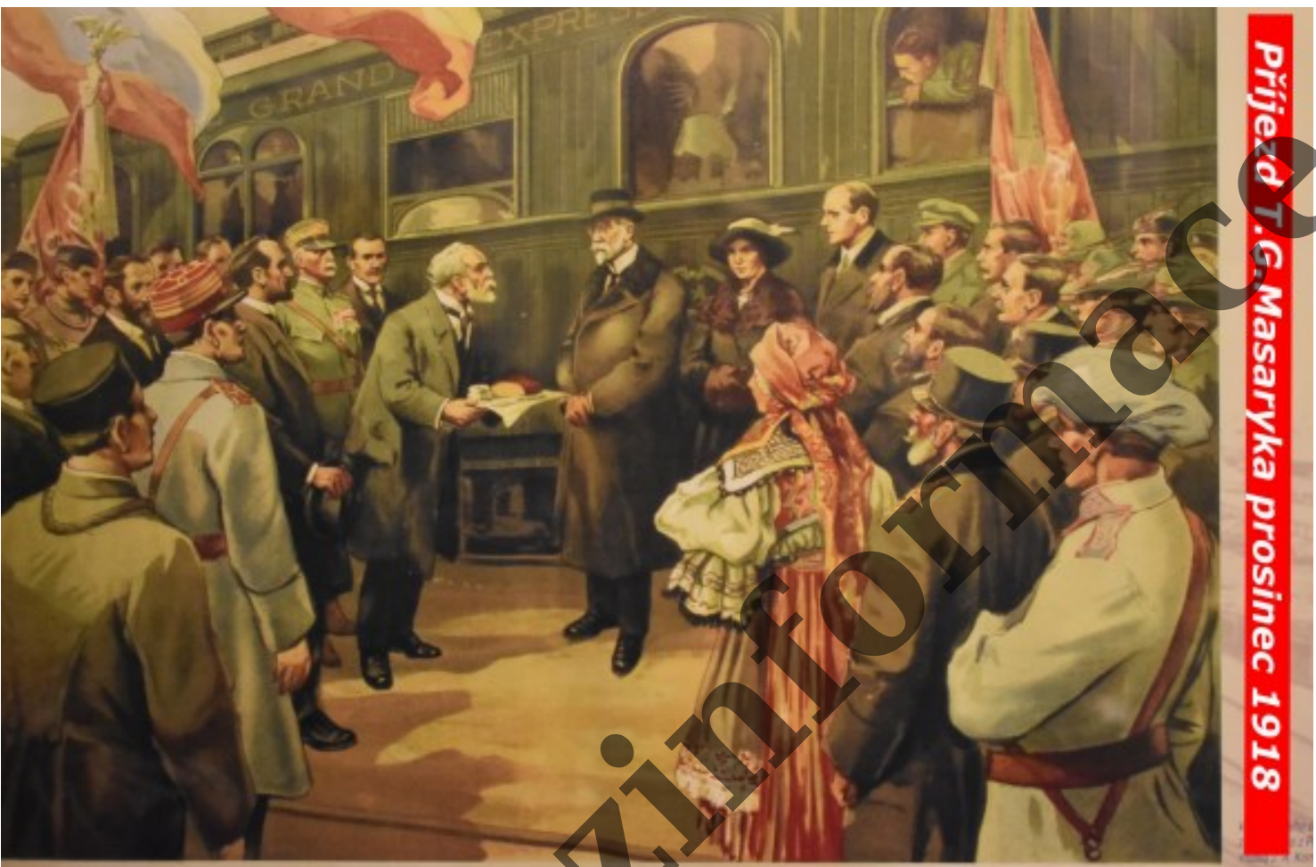
Příjezd T. G. Masaryka prosinec 1918