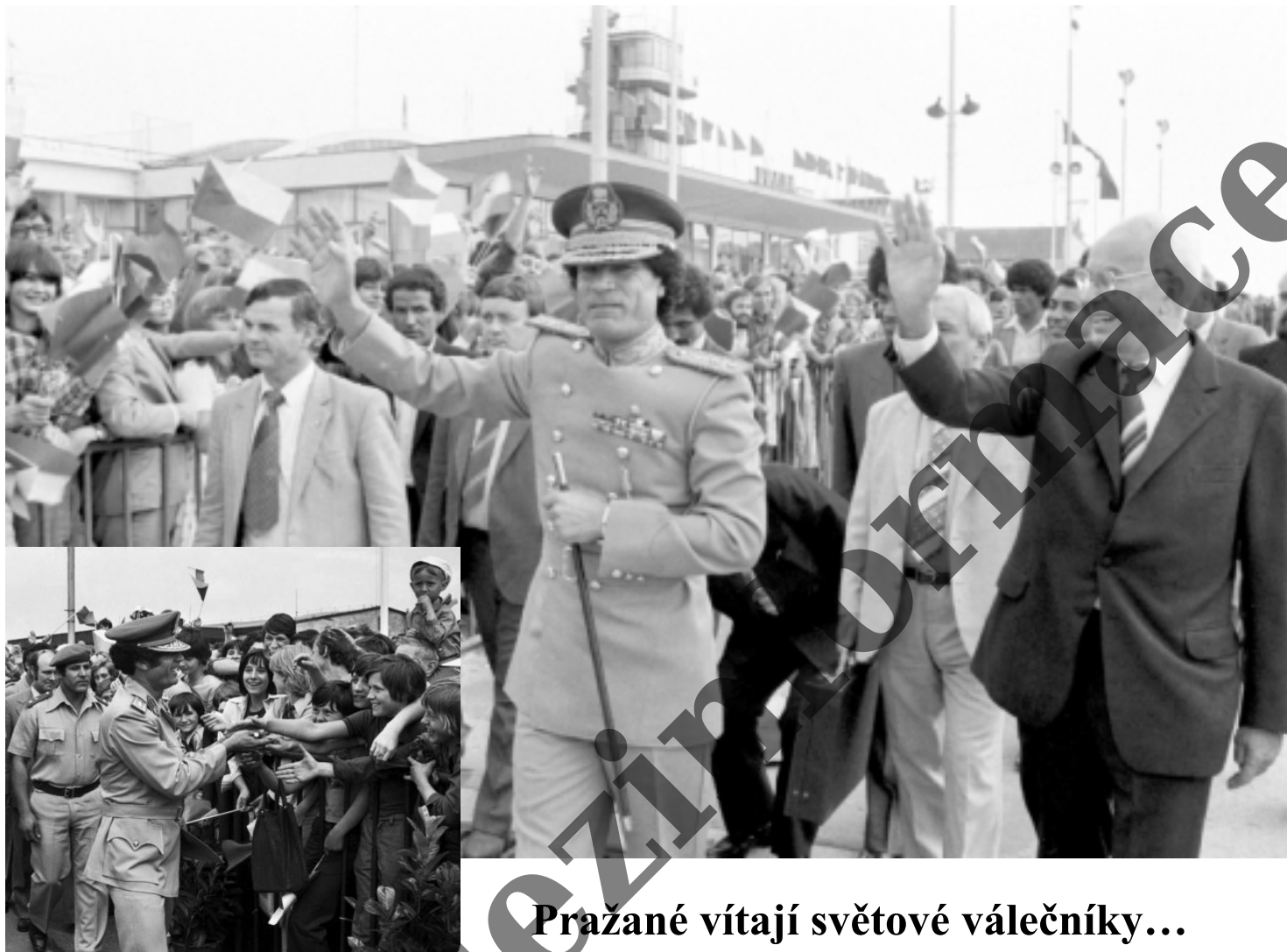
Pražané vítají světové válečníky...